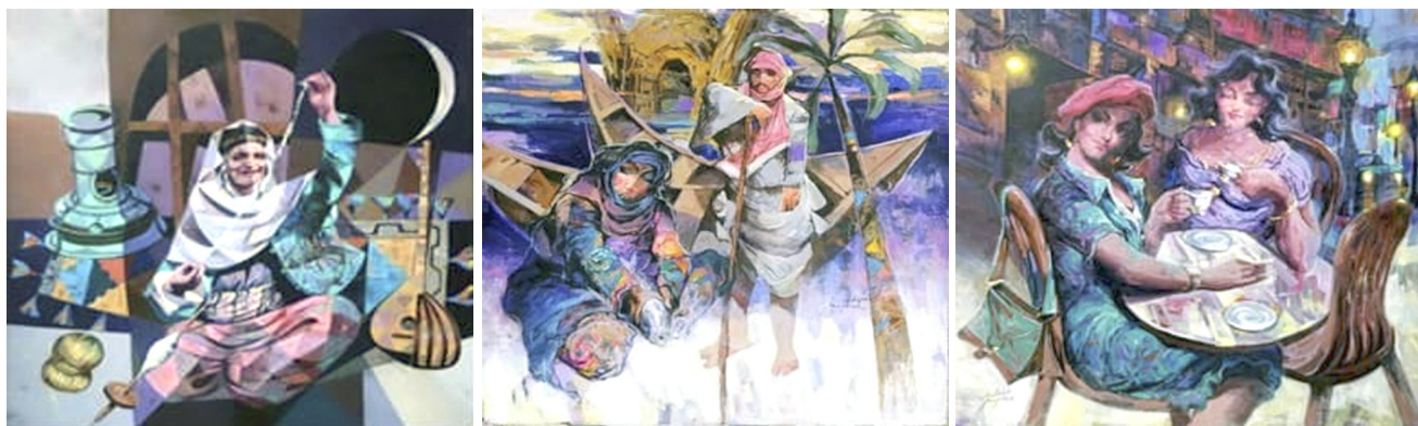
رسم: لوحات بريشة عباس هاشم