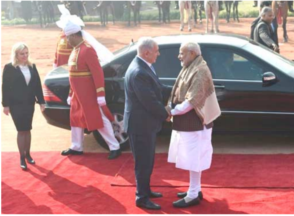
استقبال: رئيس الوزراء الهندي ناريندرا مودي يستقبل رئيس الوزراء الاسرائيلي بنيامين نتانياهو وزوجته

وقال رئيس الوزراء الاسرائيلي في المقابلة التي نشرت الاثنين "في نهاية المطاف سنخالف من القنلة لكن الهدف هو ردع قنلة آخرين في المستقبل".