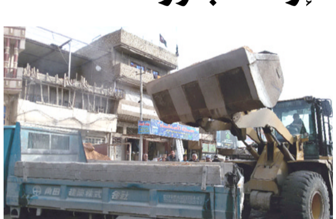
آليات الأمانة تزيل التجاوزات

بسببها ازحام الاسواق المجاورة عند الحرائق والاعتداءات الإرهابية). وأكد (المضي في إزالة كسافة بسبب هدم أمانة بغداد لبساطيته). وأضاف انه (تم العثور على جفته وتم تسليمه الى مركز شرطة الصالحية). وكانت امانة بغداد، قد نفذت، الأيام الماضية، حملة لإزالة التجاوزات من على جسر السنتك وسط بغداد، بسبب قيام امانة بغداد برفع بساطيته