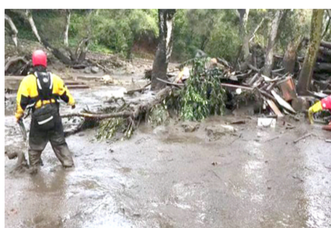
تلوج؛ إنهيارات وتلوج في كاليفورنيا

وجنوب محافظ ديالى عدا غرب البلاد تكون الرياح شمالية في المناطق من شمال العراق في المنطقة الوحيدة التي من اي نزول خفيف من أوروبا او من الغرب هذا الشهر، وأضاف ان(الرياح السائدة خلال الأيام المقبلة هي جنوبية شرقية تنشط في محافظة واسط