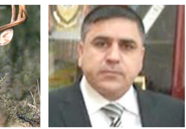
محمية الغزلان في مندلي