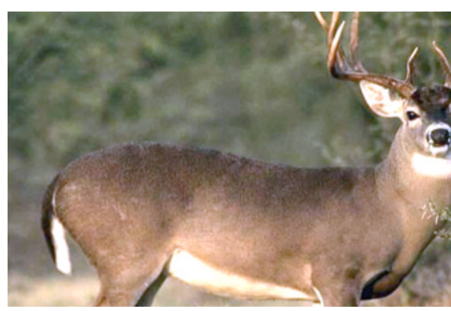
محمية الغزلان في مندلي