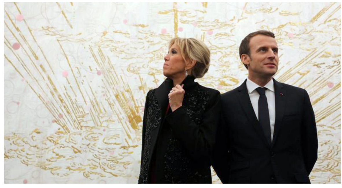
الرئيس الفرنسي إيمانويل ماكرون وزوجته بريجيت ماكرون أثناء زيارتهما لأحد المراكز الثقافية في العاصمة الصينية بكين

باريس - شاعر عبد الحميد كشف كتاب جديد عن سيرة سيدة فرنسا الأولى بريجيت ماكرون أن الرئيس الفرنسي كتب في صباه رواية إباحية تستلهم الفترة الأولى من علاقتهما العاطفية عندما كان لا يزال مراهقاً بينما كانت هي امرأة متزوجة ومدرسة الدراما في فصله. ووقع ماكرون الذي أتم عامه الأربعين الشهر الماضي في حب بريجيت أثناء جلسات التدريب على مسرحية مدرسية في مدرسة