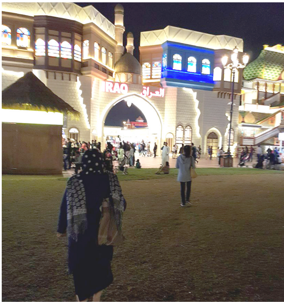
الجناح العراقي: تنتشر في أروقة الجناح العراقي بالقرية العالمية القادمة في دبي بدولة الإمارات العربية مختلف المنتجات المحلية والتراثية فضلاً على اللوحات الفنية عمسة (الزمان)