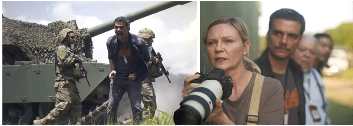
فيلم - لقطات من فيلم (حرب أهلية)