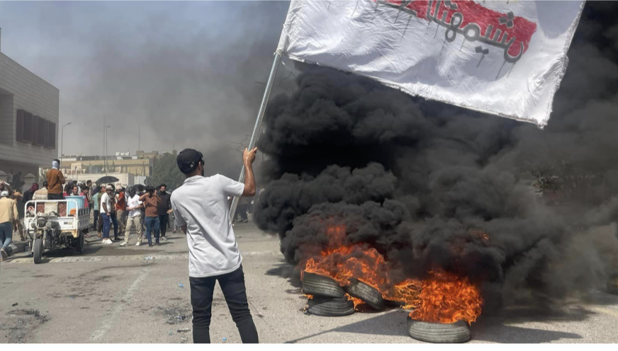
احتجاجات في ذي قار يحتجون على عدم تسليمهم بالتعيينات

راتبه التقاعدي عن 700 ألف دينار، ويشمل التقاعد الخدمة والعجز). من جانبه، قال وزير العمل والشؤون الاجتماعية أحمد الاسدي في تصريح امس ان (الزيادة ستكون على الحد الأدنى للراتب بمقدار 350 ألف دينار، ليصبح 500 ألف)، وأضاف ان (الزيادة المقررة للرواتب تبدأ من 87 ألفاً حتى 150 ألف دينار). إلى ذلك، أكد مجلس الخدمة العامة، ان (جداول موازنة العام الجاري لا تتضمن تخصيصات مالية لدرجات وظيفية جديدة. وقال