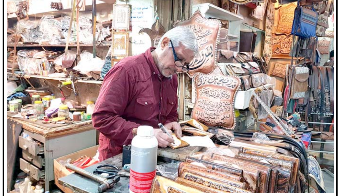
سراجه : حرفي يقوم بالنقل على الجلود في محله ضمن سوق السراجين خلف سوق السراي ببغداد عدسة (الزمان) .

ويرى الباحث البعثي كاظم الغيلاني ان (ابعاد المشكلة كبيرة خاصة وان أضرار مياه البزل الإيرانية ناتجة من مزارع تربية الأسماك الخاصة ومزارع السكر الكبيرة وتكون بحكميات هائلة). وأضاف (لقد بحثت بصور الأقمار الاصطناعية واتضح أنها مياه بزل ناتجة من مزارع أسماك ومزارع للسكر، فعندما يكون لديهم حصان قصب السكر يقومون بإفراق المزارع من المياه، وتكون حمولة بمبيدات الفطريات وهي شديدة السمية على الأمد البعيد ويسبب تراكمها في الجسم الأمراض السرطانية، إضافة إلى مياه مخلفات المصانع وهي مواد سامة ناتجة من عمليات التصنيع لمعامل البتروكيماويات ومصفي عبادان ومصانع البلاستيك الإيرانية). وأوضح الغيلاني ان