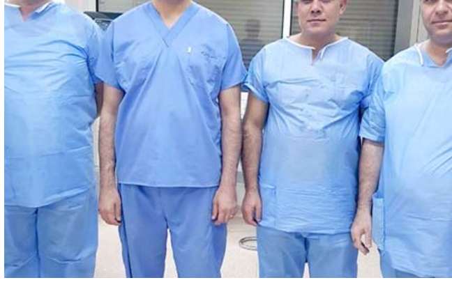
ورم: الفريق الطبي الذي نجح بإستئصال ورم من الغدة النخامية