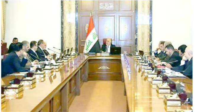
جلسة جانبية من جلسة مجلس الوزراء

وقال بيان إعلام اساتذة المجلس أمنه ان (الفريق يضم عضويته 25 جهة من الجهات ذات العلاقة بضمنها امينة بغداد رئيسة اللجنة الدائمة العليا للنهوض بواقع المرأة العراقية وممثلة الوزارات في الحكومة الاتحادية والإقليم، بالإضافة إلى دائرة تمكين المرأة الأمانة العامة للمجلس ومجلس القضاء الأعلى وجهان