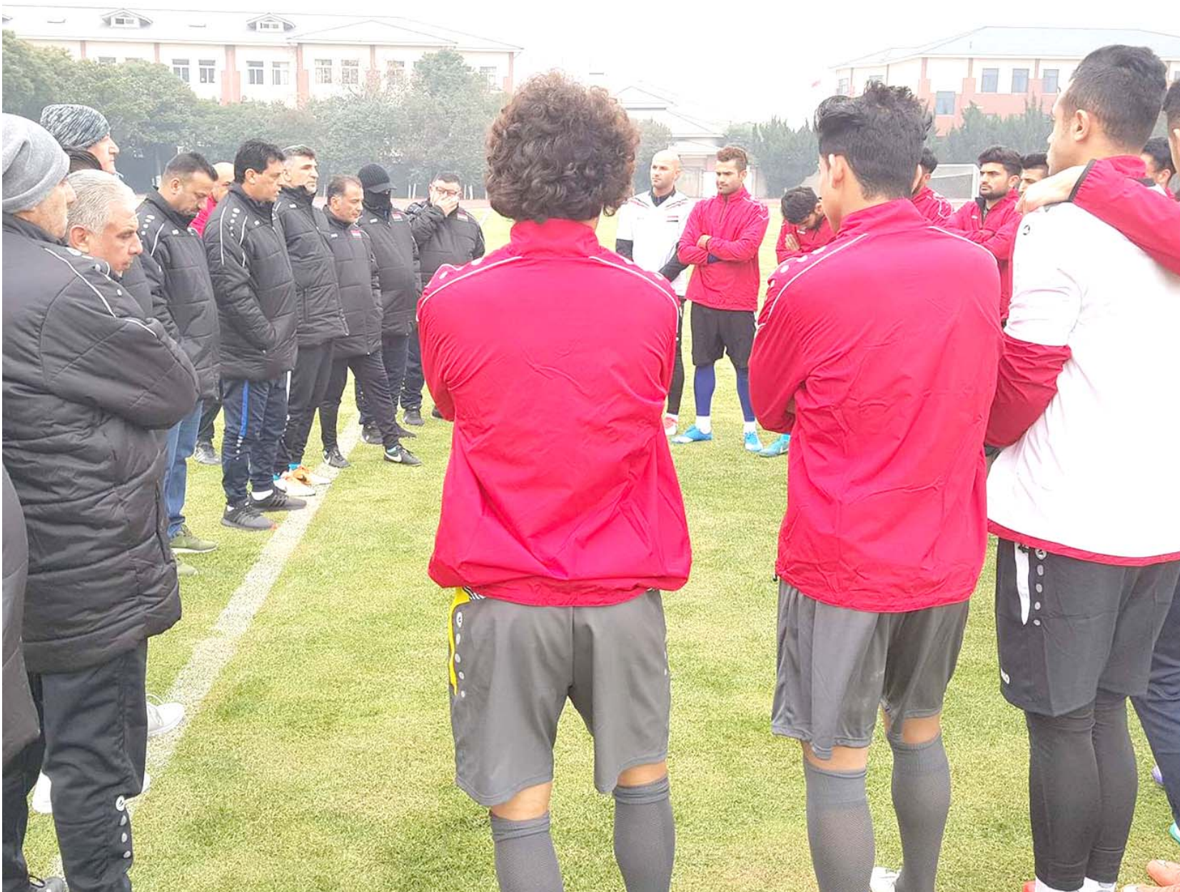
استعدادات: يواصل المنتخب الآسيوي استعداداته في الصين قبل مواجهة ماليزيا في نهائيات آسيا

أوزبكي يقود لقاء العراق أمام ماليزيا في مدينة تشانغ شو