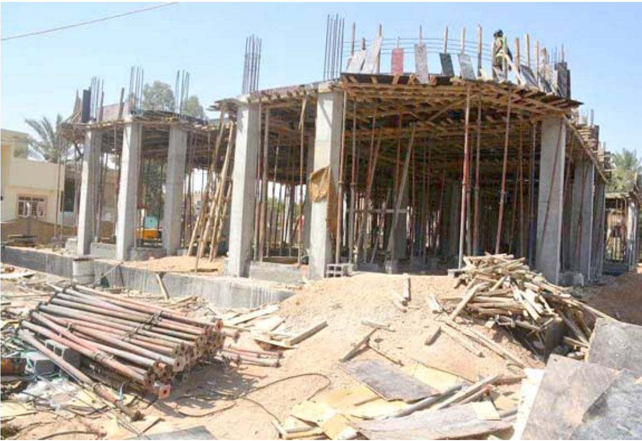
بناء موقع مشروع صحي في كربلاء.

والثاني للمركز الصحي في حين سعيون الطابق الثالث داراً للطباعة والمرضى بالإضافة إلى قاعة للمحاضرات وغرف للجوانب الإدارية وهذا ما سيوفر الخدمات الضرورية لأهالي المنطقة طوارئ في الطابق الأرضي ويتسع لـ 40 سريراً بينما الطابق الأول