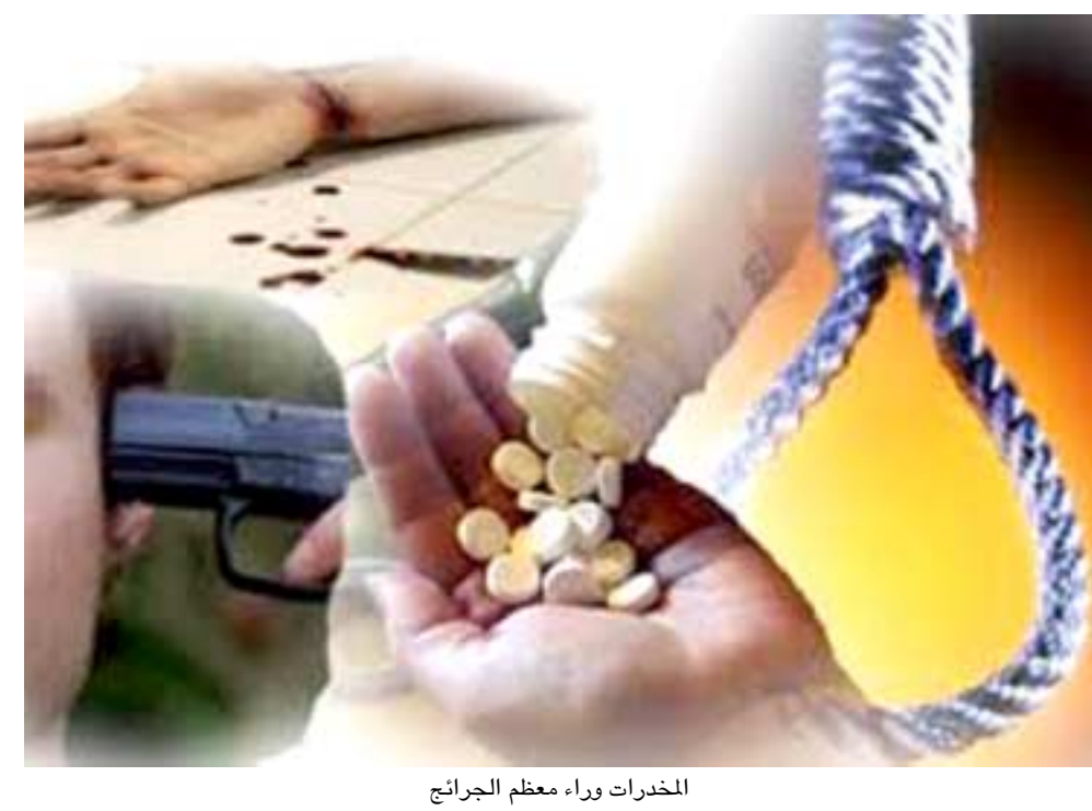
المخدرات وراء معظم الجرائم

السليمانية - الزمان أعلنت قوات الاسايش في اقليم كردستان عن احباط مخطط ارهابي تقوده خلية جميع اعضائها من النساء. وبحسب مصدر في اعلام الاتحاد الوطني الكردستاني فقد اعتقلت قوات الاسايش في محافظة السليمانية عددا من الخلايا الإرهابية خلال الايام الماضية من بينها مجموعة تابعة لتنظيم داعش جميع اعضائها نساء. واوضح ان (اسايش السليمانية فتحت تحقيقا مع المعتقلين وتبين ان احدي المجموعات التي تروج لفكر تنظيم داعش الارهابي عن طريق وسائل التواصل الاجتماعي جميع اعضائها من النساء). موضحاً ان (هدف الخلية المذكورة كان تشكيل غرفة اعلامية مشتركة). وكشف عن (تمكن الاسايش في وقت سابق من اعتقال عدد من الخلايا التابعة لداعش في