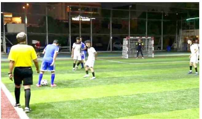
منافسات، جانب من لقاء سابق في منافسات دوري بغداد بسداسي الكرة

توجهه من بودابست المجرية إلى غوريتسا الكرواتية ومنذ ذلك الحين فقدنا كل أثر له. وأضاف النادي الكرواتي قائلاً: "ابلغنا الشرطة المجرية بالاختفاء، وندعو أي شخص لديه أي معلومات عن اللاعب إبلاغ أقرب مركز شرطة أو النادي مبيناً ان "اللاعب كان يقود سيارة (بورش تاكاجن) ببيضاء تحمل لوحات ترخيص سويدية.