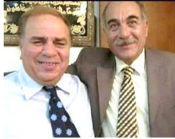
مسيرة: محطات من مسيرة وليد العبوسي الفنية