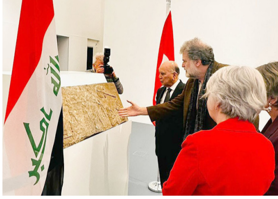
بيرون - الزمان

تسلمت وزارة الخارجية، قطعاً أثرية تعود إلى الحضارة الآشورية من سويسرا. وقالت في بيان تلقته (الزمان) أمس إنه (ضمن إطار دبلوماسية استرداد الآثار العراقية المهربة التي أطلقتها وزارة الخارجية، تسلم الوزير فؤاد حسين ثلاث قطع أثرية قيمة، تعود إلى الحضارة الآشورية القديمة، من وزيرة الشؤون الداخلية السويسرية إليزابيث بوم (شنايدر)، وأعرب حسين عن شكره للحكومة السويسرية للتعاون الذي أبدته في سبيل استرجاع هذا الإرث الحضاري العراقي، وأضاف أن الوزارة تسعى جاهدة لاسترجاع الآثار إلى العراق، مبيناً أن القطع الثلاث هي تمثال إله الشمس الآشوري وجداريتان يعود تاريخها إلى العهد الآشوري قبل الميلاد).