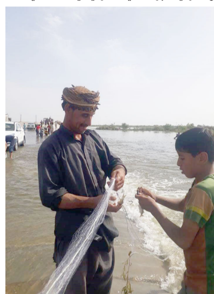
اهوار : صيادون يمارسون المهنة في الاهوار