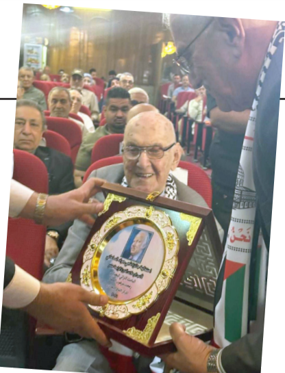
جائزة: لقطات من الاحتفاء بجائزة ناجي جواد الساعاتي لأدب الرحلات