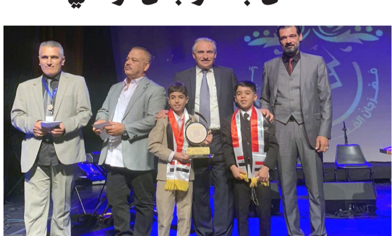
جائزة: لقطات من الاحتفاء بجائزة ناجي جواد الساعاتي لأدب الرحلات

النجف - سعدون الجابري حصلت المديرية العامة للترتبية في محافظة النجف، على جائزة أفضل ممثل في مهرجان المسرحي المدرسي العربي الأول، والذي يقام في المملكة الأردنية الهاشمية من عمل (مطيح) آخر الليل الذي شاركت فيه تربية النجف عن العراق، إلى جانب دول عدة منها السعودية والكويت وقطر وعمان بالإضافة إلى الأردن. وقال إعلام تربية المحافظة في تصريح (حصل