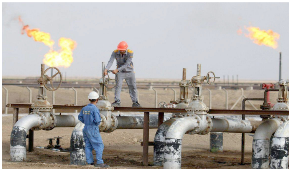
حقل : مهندسون في حقل نفطي جنوب العراق

الطاقة، للحد من الضغط الحاصل على الشبكة، وتقليص الضائعات، وتنظيم عملية الاستهلاك بما يؤمن التوزيع العادل للكهرباء).