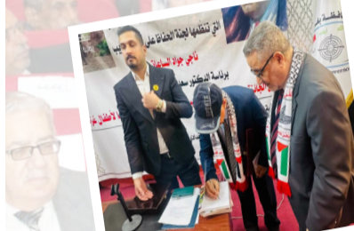
جائزة: لقطات من الاحتفاء بجائزة ناجي جواد الساعاتي لأدب الرحلات