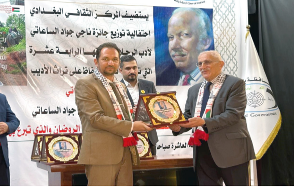
جائزة: لقطات من الاحتفاء بجائزة ناجي جواد الساعاتي لأدب الرحلات