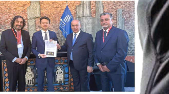
جائزة: لقطات من الاحتفاء بجائزة ناجي جواد الساعاتي لأدب الرحلات