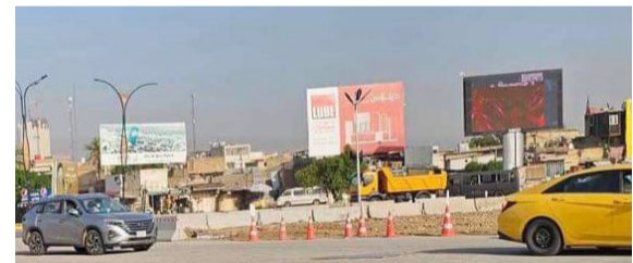
بغداد - ابتهاج العربي

لقرار المرور بالدخول إلى بغداد، والتسبب بأزمة خائفة في الخط السريع لمنطقة الدورة، مشددين على (مفازن المرور محاسبة المخالفين، وحجز مركبات الحمل التي تخالف التعليمات الصادرة). وكانت مديرية المرور قد أصدرت تعليمات جديدة بشأن دخول مركبات الحمل إلى بغداد وقال مدير قسم العلاقات والإعلام في المديرية المقدم حمزة علي الحسين إنه (استناداً لإحكام الفقرة ثانياً من المادة 47 من قانون المرور وبناء على توجيهات وزير الداخلية عبد الأمير الشمري، من أجل تخفيف العبء على السيطرات في مداخل بغداد من جميع الجهات، تم إصدار قرار بمنع فيه منعا باتا دخول مركبات الحمل أكثر من 4 طن فما فوق إلى العاصمة من الساعة السادسة صباحاً وحتى العاشرة مساءً، وأضاف انه (تقرر عدم السماح بوقوف مركبات الحمل قرب السيطرات الموجودة في مداخل بغداد)، مؤكداً أن (أصحاب مركبات الحمل فوق 4 طن بإمكانهم أن يسلكوا 3 طرق حددت لهم)، وتابع أن (هناك استثناءات من هذا القرار وهي المركبات المحملة بالمواد الغذائية والمشروبات