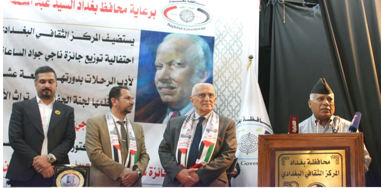
جائزة: لقطات من الاحتفاء بجائزة ناجي جواد الساعاتي لأدب الرحلات

ببروت - الزمان طرح النجم اللبناني راغب علامة عبر قناته في موقع (يوتيوب) والمصنات الموسيقية أحدث أعماله الغنائية، بعنوان (شو عامل في)، باللهجة اللبنانية أغنية (شو عامل في)، من كلمات محمد عثمان، ألحن كيريكاكوس بابادولوس، وتوزيع ناصر الأسعد، وقد صورها راغب في أثينا مع الخرج اليوناني أندراس في أكثر من موقع ميمز، وقد بدأ فيه وهو يعرف على الجيتار داخل مشغل وبمعه أفراد من فرقة موسيقية يشاركه العزف، وكانت آخر أغنية طرحها علامة (التيل تيل)، وطرحتها بطريقة الفيديو كليب، وقد لعبت بطولتها الممتلة والمخرجة اللبنانية زينة مكي.