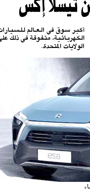
سيارة صينية تعمل بالكهرباء

وتصل سرعتها من الخبات إلى مئة كيلومتر في الساعة خلال 4 ثوانية، وتعمل الصين حالياً