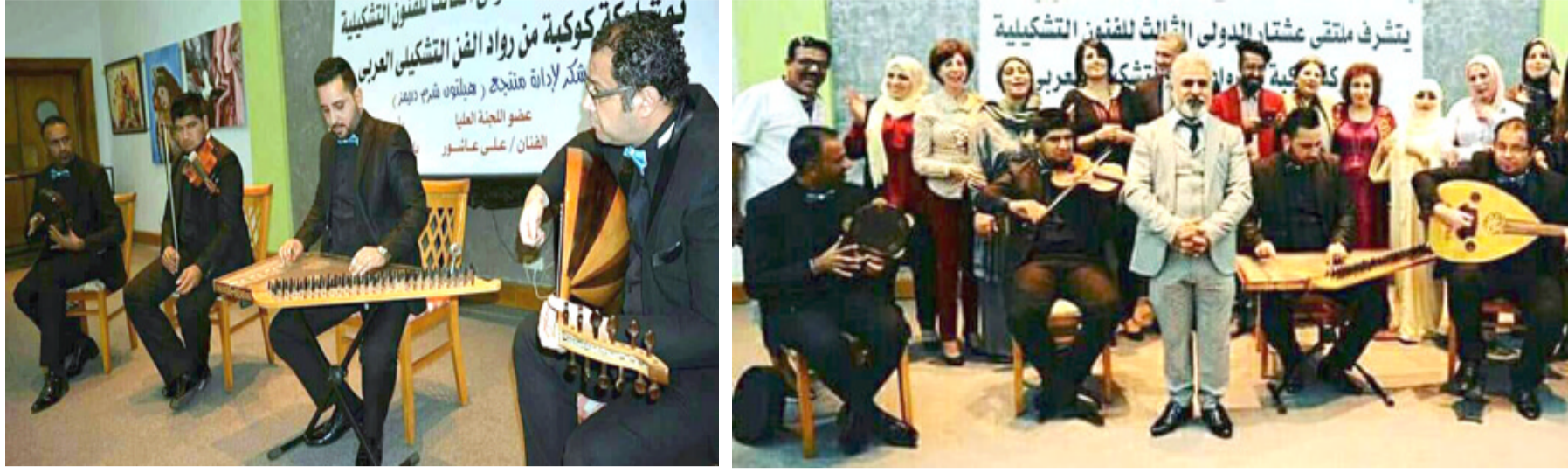
موسيقى تراثية : مساهمات فنية متميزة لفرقة حب (الزمان)

واستمرت أغنية (بيرفكت) لإد شيران في صدارة قائمة الأغاني الرقمية التي تقيس مبيعات الأغاني الفردية على الإنترنت، بفضل نسخة صدرت حديثا بالاشتراك مع بيونسيه. وباعت (بيرفكت) 97 ألف نسخة أخرى لتحتل على المركز الأول.