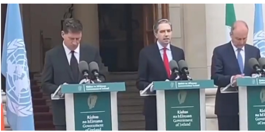
مؤتمر: رؤساء حكومات إسبانيا والنرويج وإيرلندا في مؤتمر صحفي مشترك

وايد العراق والسعودية وبدول أخرى، خطوة الدول الأوروبية بالاعتراف باستقلال فلسطين. وسط توقع اتساع دائرة الاعتراف بالحقوق الفلسطينية. كما فمن الأردن على لسان وزير الخارجية أمن الصفدي (بالقرارات التي اتخذتها دول اوروبية صديقة). وقال في بيان امس (نحن نؤمن هذا القرار، ونعتبره خطوة مهمة وأساسية على طريق حل الدولتين الذي يجسد دولة فلسطينية مستقلة ذات سيادة على حدود الرابع من حزيران من عام 1967). وكانت ثلاث دول اوروبية قد اعترفت بدولة فلسطين في خضم الحرب الدائمة في قطاع غزة بين إسرائيل وحركة حماس، في