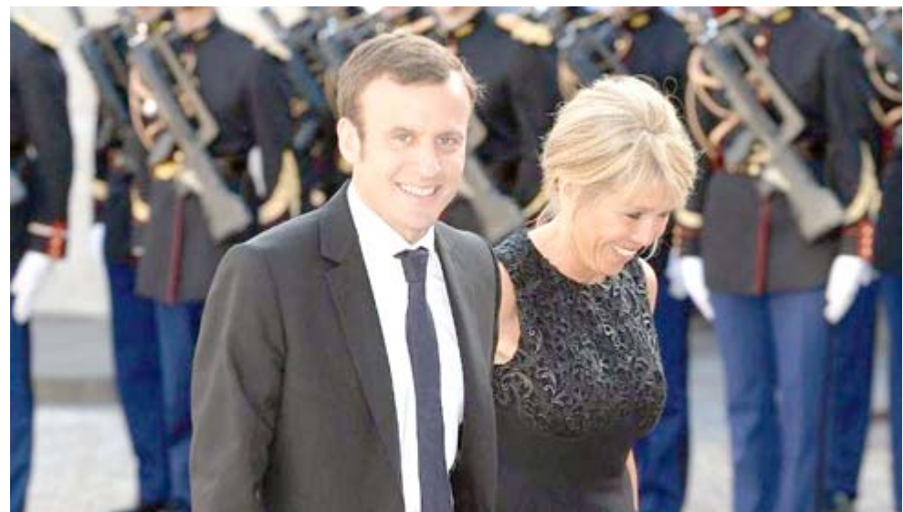
حفل الرئيس الفرنسي ايمانويل ماكرون وبجانبه زوجته خلال الاحتفال بعيد ميلاده

في مجمع القصر "سكافا" بسبب رمزيتها الملكية. تأتي عطلة ماكرون في وقت تميز فيه أن العديد من وزراءه من المليونيرات.