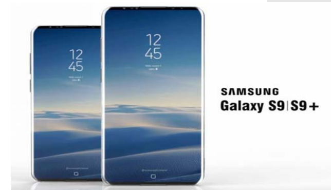
Samsung Galaxy S9 | S9+

وعلى الرغم من سعره المرتفع والذي يبدأ بحوالي ألف دولار فإن هاتف آيفون X حظي باستحسان الأوساط التقنية ومن المتوقع أن تساهم مبيعاته في تعزيز عائدات شركة آبل والتي قدرها المحللون بأنها ستصل إلى نحو 80 مليار دولار في الربع المالي الأول. وفي الربع المالي الثالث، أي قبل طرح آيفون X في الأسواق، تصدرت سامسونج مبيعات الأجهزة الذكية بحصة بلغت حوالي 22 بالمئة من السوق العالمي، وذلك وفقاً لبيانات صادرة عن شركة آي دي سي للبحوث. وجاءت آبل والتي حظيت بنحو 13 بالمئة من مبيعات الهواتف الذكية في العالم. وتوقعت شركة ستراتيجي أنلايتس بأن حصة سامسونج من السوق العالمي سينخفض إلى أقل من 20 بالمئة في عام 2018، وذلك وفقاً لعدد من التقارير الإخبارية من جهات متعددة.