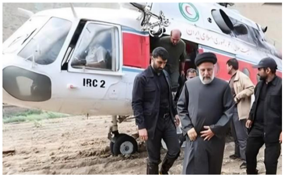
طهران - رزاق نامقي

افادت تقارير إيرانية، بعثت فرق البحث على حطام الطائرة الرئاسية التي تقل الرئيس ابراهيم رئيسي ووزير خارجيته حسين امير عبد الهسيان، فيما نفي الهلال الأحمر الإيراني، وأوضح عن المروحية. وأوضح في بيان امس ان (أعمال البحث مستمرة في ظل الأحوال السيئة)، وتوجهت فرق الإنقاذ التي مكان سقوط الطائرة الرئاسية، انشاء زيارة اجراها رئيسي الى محافظة انزليجان الشرقية، بالتنسيق مع فرقته نظيره الأذربيجاني الإيهام عفيف على الحدود بين البلدين، وعرض العراق، المساعدة على ايران للمشاركة في عمليات البحث بعد ساعات من اختفاء الطائرة المروحية بطررف غامضة وقال الناطق الرسمي باسم الحكومة باسم العواد في بيان تلقته (الزمان) امس إن (رئيس الوزراء محمد شياع السوداني وجه وزارة الداخلية والهلال الأحمر العراقي وبقية الجهات المختصة لعرض الإمكانات المتوفرة على ايران للمساعدة في البحث عن طائرة رئيسي التي فقدت في شمال إيران). وابتدأت السعودية قبلها البالغ إزاء الأنباء الواردة من إيران عن تعرض مروحية كان على متنها رئيسي، وقالت وزارة الخارجية السعودية في بيان امس إن (الرياح وازدواج بقفل بالآلة الأثرية بشأن حادث مروحية رئيسي، فانها تؤكد وقفها إلى جانب طهران في هذه الظروف الصعبة واستعدادها