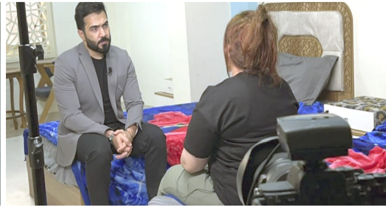
برنامج - لقطات من برنامج (كلام الناس) في مركز تاهيل القناة