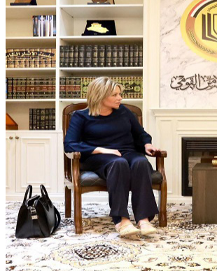
استقبال : مستشار الامن القومي العراقي خلال لقائه بلاسخارت

بغداد - قصي منذر شدد مستشار الامن القومي قاسم الاعرجي، وممثلة الامن العام للاعلام المتحددة في العراق جينين بلاسخارت، على أهمية حسم ملف مخيم الهول السوري. وقال بيان تلقته (الزمان) أمس إن (اللقاء بحث آخر المستجدات السياسية والأمنية في المنطقة، فضلاً عن بحث استمرار التعاون والتسيق بين العراق والجنس الدولي، في مجال مكافحة الإرهاب والملف اللبناني)، وأضاف أن (الجانبين شددا على أهمية حسم ملف مخيم الهول السوري بشكل كامل، وإجراءات الأمم المتحدة بهذا الخصوص).