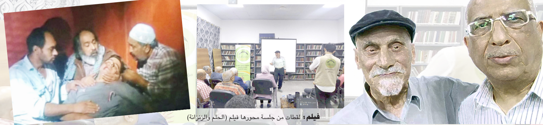
فيلم: لقطات من جلسة محورها فيلم (الحلم والزنزانة)