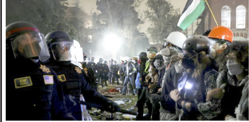
تأييد: مواجهة بين الشرطة وملازم مؤيدي الفلسطينيين في جامعة كاليفورنيا بولس أنجليس