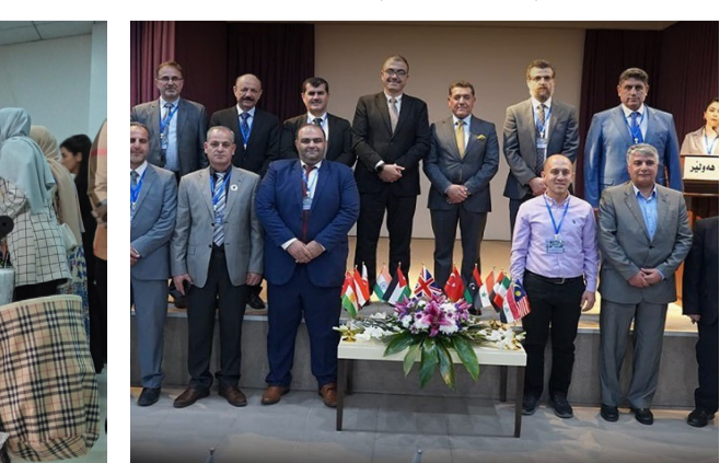
مؤتمرا، جانب من فعاليات مؤتمر هندسة الاتصالات