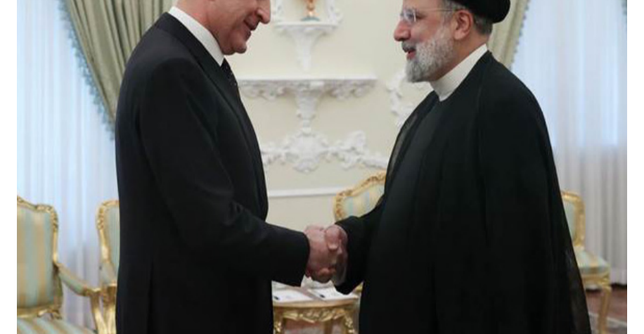
استقبال: الرئيس الإيراني يستقبل في طهران رئيس إقليم كردستان

اتفق رئيس الإقليم نجيبفران البارزاني، مع الرئيس الإيراني إبراهيم رئيسي على تعزيز علاقات التعاون ورفع مستوى التبادل التجاري بين البلدين. وقال بيان تلقته (الزمان) امس ان (رئيسي استقبل في طهران . البارزاني والوفد المرافق له الذي ضم وزير الداخلية ربيع احمد وعدد من المسؤولين في