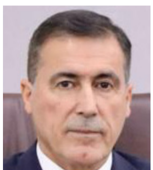
تسعين حسين مبارك