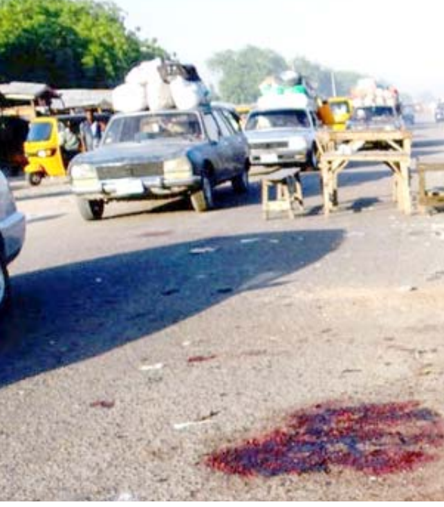
تفجير: نيجيري يقف بالقرب من موقع هجوم انتحاري في فايدوغربي شمال شرقي نيجيريا

ويعد حوالى اسبوع على تحرك الجيش بسبب عزلته، خرج منانغوانا من صهته للمطالبة هو ايضا باقالة رئيس الدولة الذي