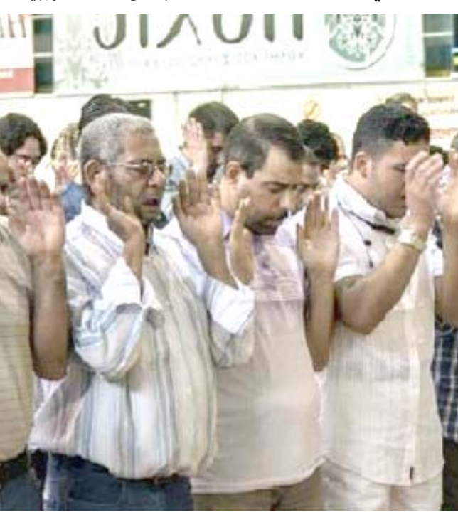
أداء: مسلمون يؤدون الصلاة في اليونان

على ظلم للمرأة في مجالات الطلاق وحضانة الأطفال والأرت. وتأتي المبادرة الحكومية اليونانية في الوقت الذي ستخضع فيه المحكمة الاوربية لحقوق الانسان للمرة الاولى في هذه المسألة في جلسة مقررة في السادس من كانون الاول/ديسمبر افر شكوى من الازملة مولا سالي (67 عاما).