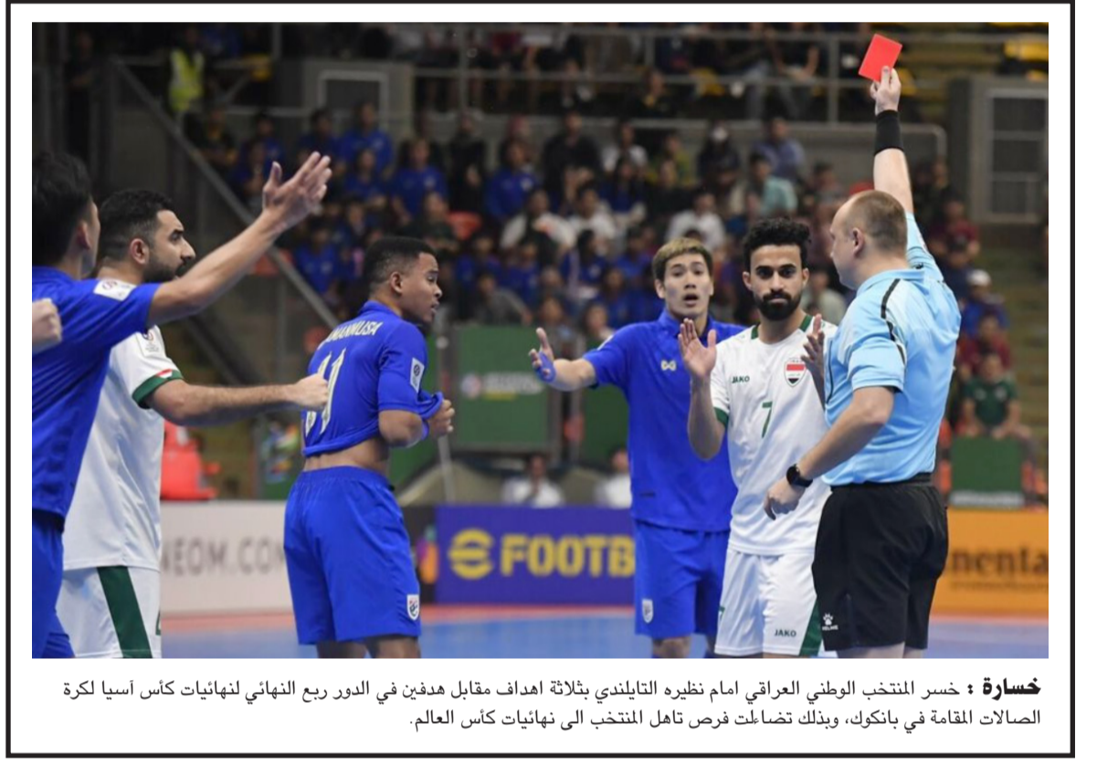
خسارة: خسر المنتخب الوطني العراقي امام نظيره التايلندي بثلاثة اهداف مقابل هدفين في الدور ربع النهائي لنهايات كأس آسيا لكرة الصالات القادمة في بانكوك، وبذلك تضاعفت فرص تاهل المنتخب الى نهائيات كأس العالم.