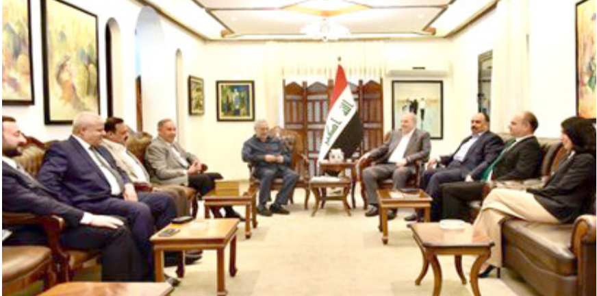
بغداد - ابتهاج العربي

استقبل رئيس ائتلاف الوطنية اباد علاوي، اعضاء كتلة الصدارة، مناقشة متحدثات القوى بشأن اختيار رئيس مجلس النواب الجديد. وقال بيان تلقته (الزمان) امس ان (اللقاء بحث مسجديات الوضع السياسي في البلاد والاستمرار في تقديم الدعم لحكومة محمد شياع السوداني في تنفيذ برنامجها الحكومي وتحقيق الامن والاستقرار وتقديم افضل الخدمات لابناء الشعب)، وأشار الى ان (الاجتماع شدد على ضرورة تكثيف الصورات الوطنية والاسراع في حسم مسألة اختيار رئيس مجلس نواب واختيار شخصية وطنية وعاما وكاملا لكل اطراف الشعب، خلق مركزية باختيار المصطلح الوطني وهو الأعم رغم أن هناك من قد يستنكر على المصطلح الشيعي باعتباره إن الشيعية هم المكون الأكبر والفاعل الرئيس والأساس في محاربة الفساد. وقال المنصوري في تصريح امس ان (المشروع يمثل توجهنا لبنية مجتمعية معارضة للفساد تضم كل طوائف الشعب تبدأ من