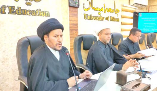
نقوة ، جانب من ندوة في جامعة ميسان