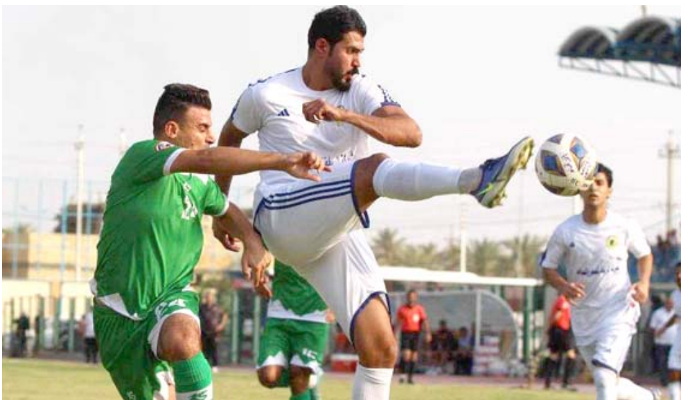
فوزه جانب من لقاء صلاح الدين والانباء الذي انتهى بفوز كبير لأول بستة اهداف مقابل ثلاثة

وكلاهما باربع نقاط ففوزهما على دهوك وتعاولهما مع السليمانية وكلاهما بخمسة اهداف لكن الافضلية للضيف بفارق الاهداف يتلقى هدف فيما تلقى اربيل هدفين وكلاهما يدركان ان الفوز وحده سيدعم صاحب للناهل مباشرة وربما التعادل كذلك اذا ما تعثر السليمانية في مباراة حاسمة للصراع على الصدارة وخوض الاختبار الحقيقي من اجل الترشح للور النهائي من جانبه يامل السليمانية بتعثر اي منهما من اجل الناهل عندما يضيف دهوك الذي خرج من البطولة بخسارتين وتلقي ثمانية اهداف وسجل هدف واحد وكل الدلائل تشير الى قدرة اصحاب الارض بنقطتين في تحقيق الفوز وزيادة رصيد الاهداف لدعم جهود وفرصة السريفي في حسم الاسور لمصلحة ولثة افضل من دهوك الهش الذي خضع للخسارة مرتين بشكل غير متوق لكن صاحب الارض مرشح للفوز لاخر من سبب.