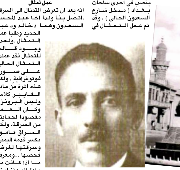
تمثال السعدون ببغداد

القادر الكيلائي ، وخوفا من تشكيل الازراء تحت الوصية بتوافقهم وشهدياتهم ، وملا الحزن والاسى جميع الناس وبقوا طويلا يتذكرون هذه الماساة التي ضحى فيها رجل كريم بنفسه على سبيل فكره ، وتجدد نحلهم بعد ان مات ابنة الوحيد (علي منحترًا)