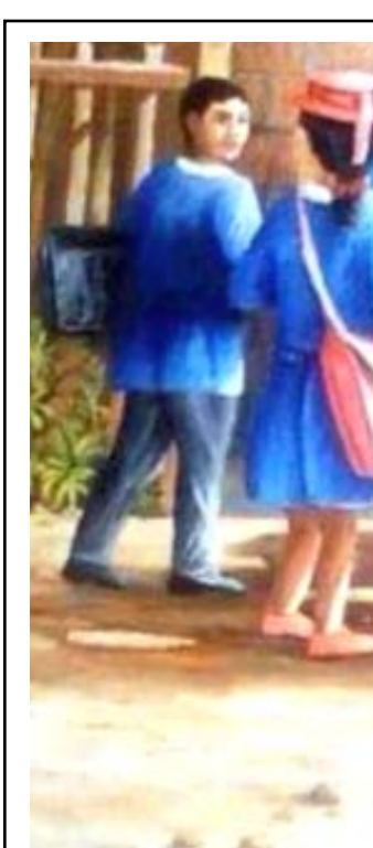
توعية : أخصي المعلم ... اختي المعلمة ... قد يتأخر الطالب في شراء اللوازم المدرسية فلا داعي لتكثيره امام زملائه او توبيخه . كن إنساناً قبل ان تكون استاذاً وأحذر أن تسهر قلب بيتك ، او فقير . ذنبه الوحيد أنه وجد نفسه في الحياة □ مجموعة واتساب

على المتهم مباشرة وفقاً لهذه المواد دون الحاجة لأمر قضائي . ويستطرد التعميمي إن المادة 229 من قانون العقوبات تنطبق على فعل المتهمين بالإساءة لرجال المرور وهي الاعتداء على الموظف أثناء الواجب وتصل عقوبتها إلى الحبس سنتين . وفي الوقت الذي يرى فيه الناس أن هناك تجاوزات وتبديراً في استخدام الموارد، فإن ذلك يؤثر على تقديم الخدمات العامة الملائمة للمجتمع .