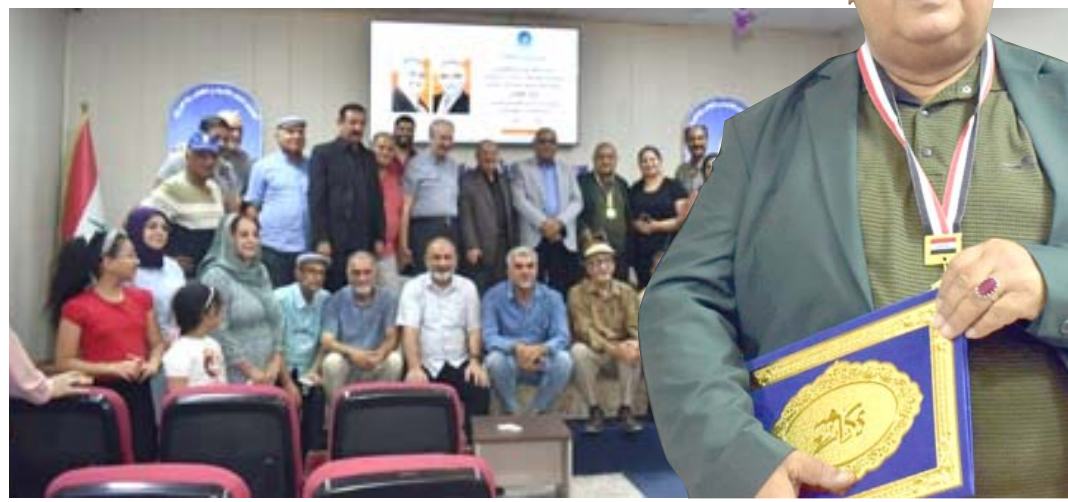
احتفاءاً لقطات من احتفاء الملتقى الاداعي والتلفزيوني بزوار علوان