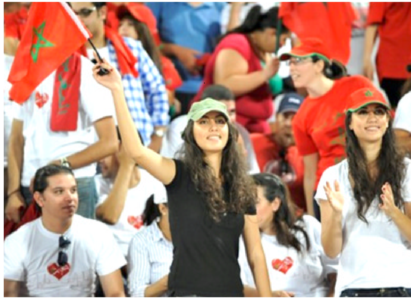
تأهل! مشجعات المغرب يلوحن بالأعلام محتفيات بتأهل أسود الأطلسي لمونديال روسيا