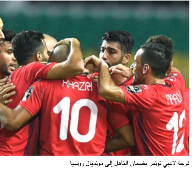
فرحة لاعبي تونس بضمأن التأهل إلى موندنال روسيا

صحيفة سبور الإسبانية علقته أيضاً، قائلة: تونس تحجز مكانها أيضاً بروسيا. تعادل سلبي في رادس تونس تحصد 14 نقطة، وتحتصدر مجموعتها على الرغم من فوز الكونغو الديمقراطية في مباراتها. وأخيراً في عام 2006.