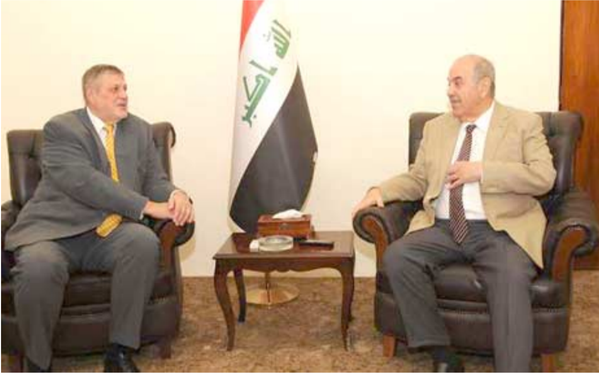
استقبال نائب الرئيس الجمهورية ياد علاوي يستقبل الممثل الخاص للامم المتحدة في العراق يان كوبيتش

مضيفا (يجب أن يجري حوار معقود بين الأطراف السياسية بكرديستان لإنقاذ الإقليم من وضعه الراهن، فلا يمكن بعد الآن أن نتخلى ما سبقولته رئيس حزب أو منحدت حزبي وما سيكون موقفهما من الأحداث الجارية على الساحة السياسية، فالواقع تغير ويفترض أن نسمي القوى الجماهيرية الفاعلة في رسم السياسات المستقبلية)، وتابع إن