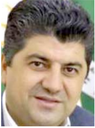
لاهور شيخ جنكي