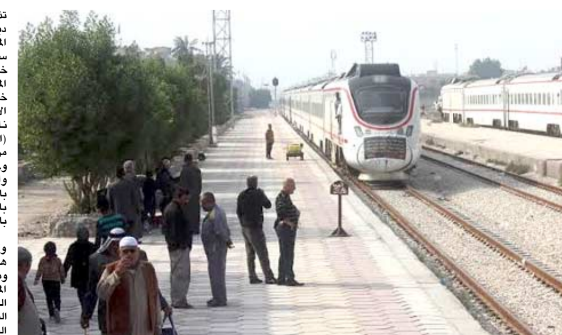
قطار وصول زائري الأربعينية إلى كربلاء بالقطارات

وقر وفد من محافظة مشهد على توفير قطارات اخرى للوافدين لزيارة الأربعينية). وتابع ان (هؤلاء الزائرين حال وصولهم إلى منفذ الشلاحة يتم نقلهم بالاحفلات إلى محطة قطار المحافظة ومنها إلى كربلاء). لافتا إلى (وجود مقترحات مبدئية تقضي بتخفيض اسعار