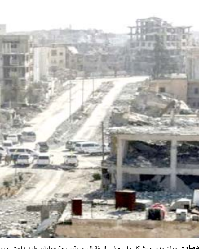
دمار: مبان مدمرة بشكل واسع في الرقة السورية نتيجة عمليات طرد داعش منها

واشنطن تعزز دورها العسكري في أفريقيا لمواجهة داعش