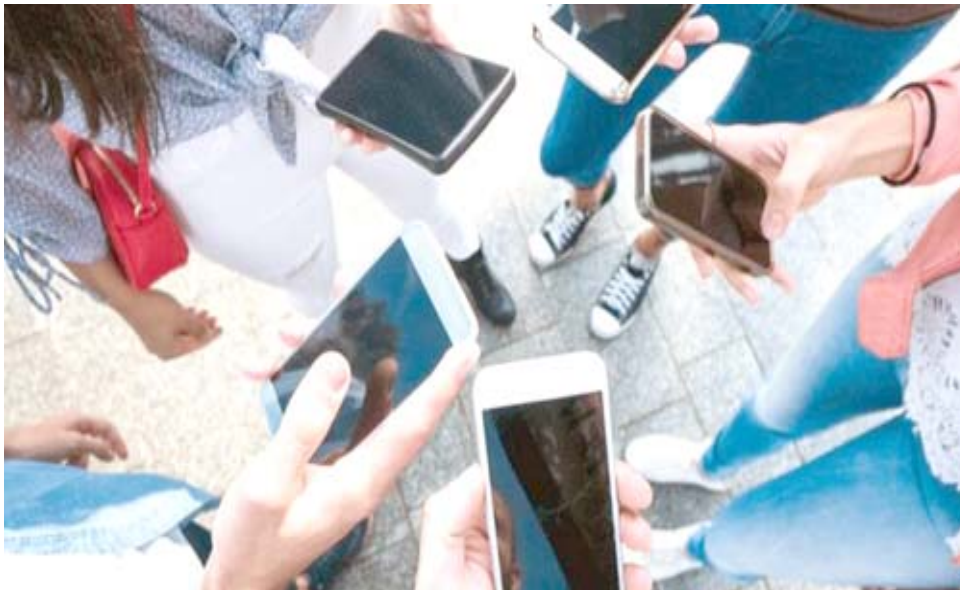
مستخدمون للاتصالات الإلكترونية

وقال محلل أمن إلكتروني إن ثغرة أمنية قد تعرض "معظم" الاتصالات بالشبكة اللاسلكية للخطر حتى يجري إصلاحها. وأضاف المحللون أن طريقة الهجوم "مدمرة" بشكل استثنائي لأنظمة أندرويد 6.0 أو الأكثر تطوراً وأنظمة لينوكس المستخدمة في تشغيل الأجهزة.