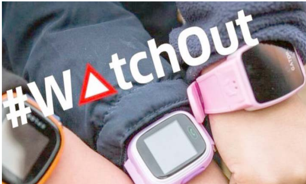
ساعات الأطفال قابلة للإختراق

سن صغيرة وأضافت ديفيس "سمعنا من الأطفال أن ثلاثة من بين كل أربعة منهم في الواقع يفضلون الحديث مع شخص في مثل عمرهم بشأن هذه المشكلات لذا فإن تعليم أشخاص في سن صغيرة المهارات التي يحتاجونها ليصبحوا مستشارين من هذا النوع هو أمر مهم جداً لنا. وإلى جانب منح الأطفال وسائل للتغلب على التنمر على منصات مثل فيسبوك أو إنستجرام أو سناب شات، سيسهم البرنامج أيضاً في التغلب على محاولات الاستغلال الجنسي للأطفال عبر الإنترنت ومخاطر أخرى.