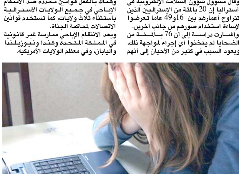
الانتقام الإباحي مشكلة في إنترنت