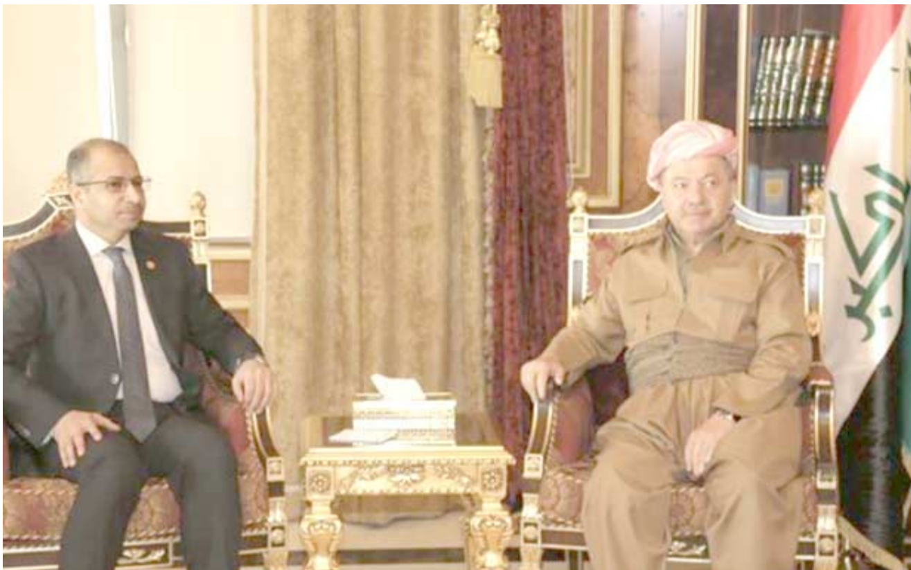
مسعود البارزاني خلال لقائه رئيس البرلمان سليم الجبوري في أربيل

سؤالاً مفاده، هل يحصل صدام مسلح، لا، لن يحصل صدام مسلح، وبالنسبة للحكومة العراقية هذا الأمر مستبعد. وأضاف أن البشمركة على وعي والجيش العراقي على وعي ولن يحدث أي شيء في هذا المجال. وأكد أن حركة الطيران الداخلية مستمرة وحركة السيارات بين المدن العراقية مستمرة أيضاً. وصادقت المفوضية العليا للانتخابات والاستفتاء في كردستان على النتيجة النهائية للاستفتاء. وقالت المفوضية في وثيقة نشرت باللغة الكردية وحملت توقيع أعضاء مجلسها أن النتيجة النهائية بلغت 92,72 بالمئة التصويت ب دعم للاستقلال.