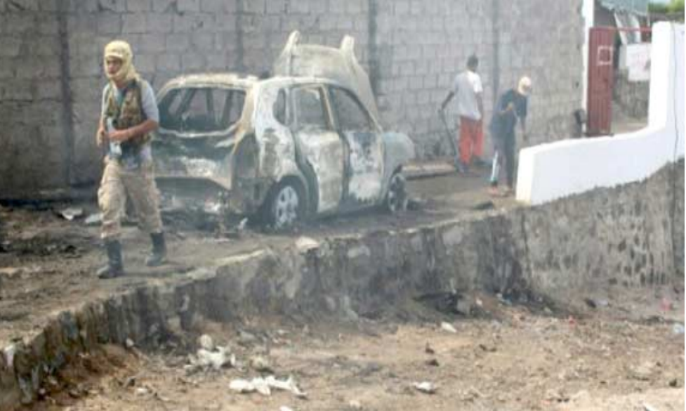
دمع اغتيل رجل دين يمني مقرب من القوات التي تدعمها دولة الامارات العربية المتحدة في مدينة عدن