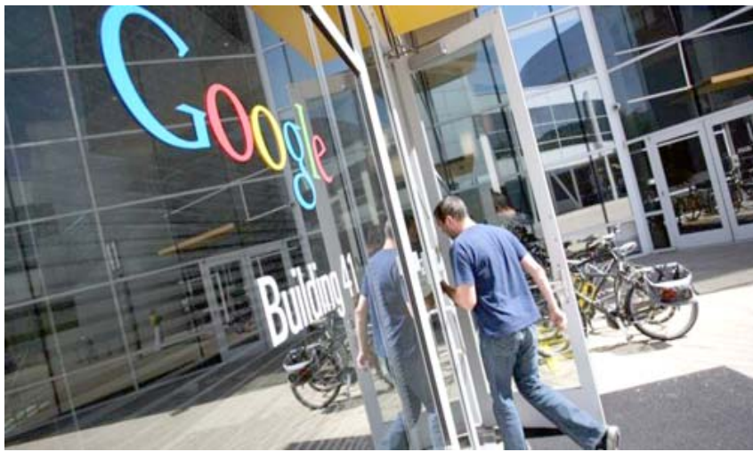
مبنى شركة غوغل

وكانت وكالات الاستخبارات الأمريكية قد قالت في وقت سابق من العام الحالي إن موسكو تدخلت في الانتخابات الرئاسية. ونشرت صحيفة واشنطن بوست الأمريكية تقريراً أشار إلى أن روسيا مولت إعلانات استهدفت تضليل الناخب الأمريكي عبر المواقع التابعة لغوغل، من بينها يوتيوب والبريد الإلكتروني "جي" وأضاف التقرير أن الإنفاق على