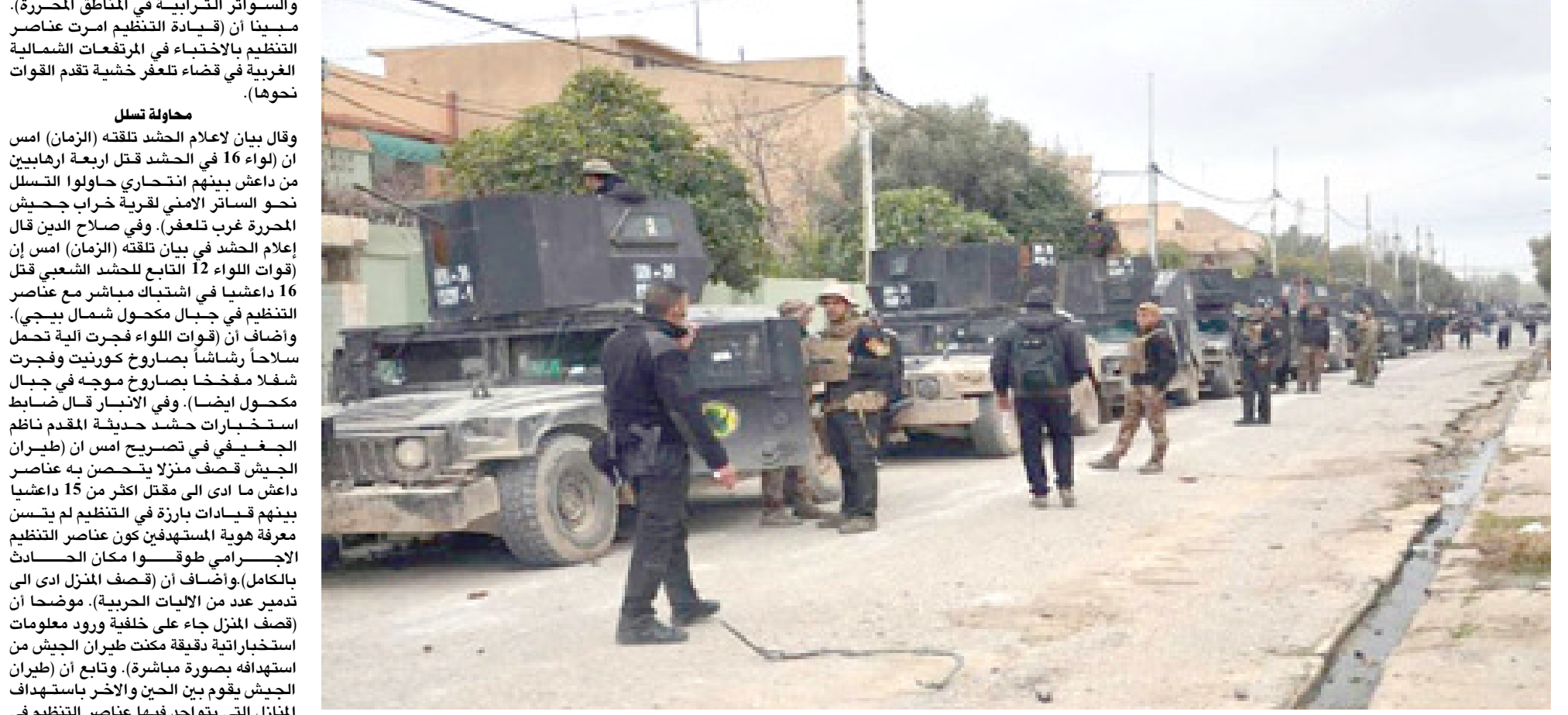
صولة: جهاز مكافحة الإرهاب يتبها لصولة باسلة على داعش في الموصل