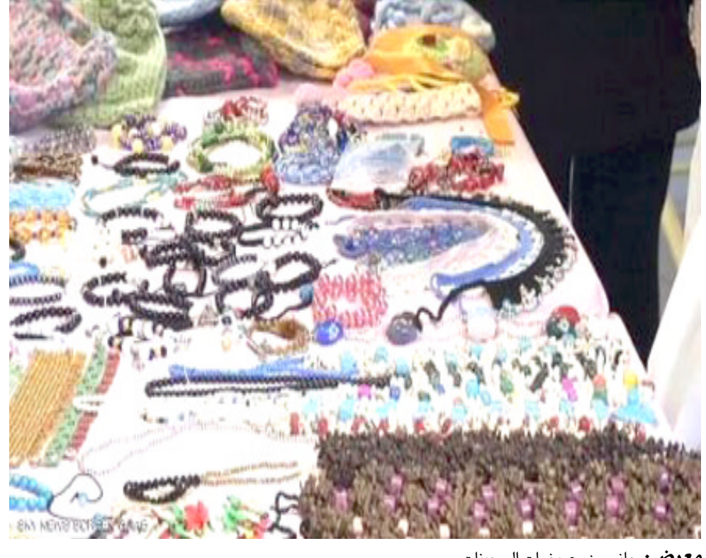
معرض: جانب من معروضات السجينات

بمهارات لمساعدتهم على الحياة خارج منظمة رئيسية للمعرض إن الهدف الرئيسي هو تقديم المساعدة المالية. وأوضحتم لآمن برزان (نحن منظمة المركز الوطني لحقوق الإنسان قفنا بهذا السوق وبهذا التسويق للأطفال والنساء الموجودين داخل الإصلاحية التي الصوف والأشياء الموجودة في المعرض هي أشياء مصنوعة يدويًا من قبل الأطفال والنساء في السجن ونقوم ببيع هذه الأشياء وإرجاع المبلغ لهم نحن كمنظمة حقوق الإنسان عندما الكثير من الأعمال داخل الإصلاحية (السجن) أما هذه السوق هي واحدة من أعمالنا الأشياء مصنوعة من الصوف وأشياء عبارة عن إكسسوارات تقوم ببيعها لهم ونرجع المبلغ إلى الأطفال والنساء الموجودين داخل الإصلاحية ودعم للمنظمة التي قامت بهذه المبادرة لتنظيم هذا المعرض. وأطلق من الجهات المعنية ومن المنظمات الإنسانية الأخرى أن تقوم بتنظيم ورش عمل في داخل الإصلاحات (السجون).