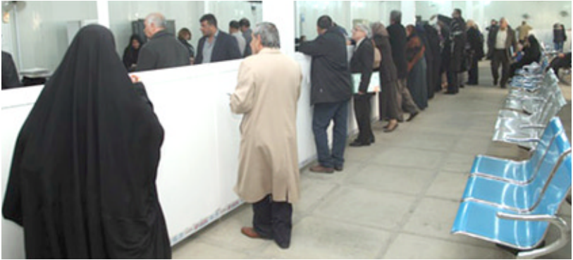
زيائن مصارف يتظنون أموالهم

وإعماله وفروعه حيث يتوفر لديه حالياً أنظمة فعّالة تغطي جميع أنشطة المصرف ويتم تطوير النظم باستمرار وتحديث المعلومات ، كما يساهم مساهمة فعّالة في تطوير وإسناد المصارف الحكومية والإهلية في مجال الائتمنة المصرفية والاستثمارية الفعّالة .