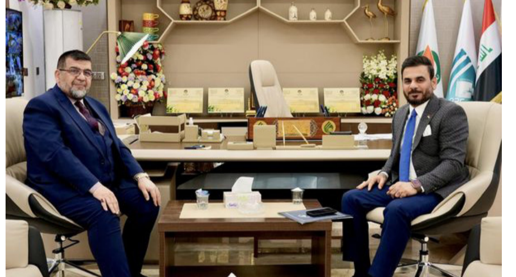
زيارة: النائب الجوراني يزور شركة الانابيب

الغاز المصاحب، معلنة عن توجهها لاستثمار الغاز المصاحب في جنوب العراق، وقال المدير التنفيذي للشركة، مهدي الصفر، في تصريح امس ان (الشركة تعمل مع الحكومة على استثمار الغاز المصاحب، لإغراض البيئة وتقليل المصاريف الحكومية التي تقدر بمبالغ كبيرة، فضلاً عن امان الطاقة داخل العراق)، وأوضح الصفر ان (الشركة تواصل المناقشات مع وزارتي الكهرباء والنفط لغرض الشروع بهذا خلال السنة القريبة بإستثمار الغاز في الجنوب، معرباً عن تقديره لجهود الحكومة بتذليل المصاعب، مشيراً الى (الطموح في استمرار الدعم لغرض إكمال العقود وتنفيذها على أرض الواقع). الى ذلك، زع وزير النفط، حيسان عبد الغني، 6598 قطعة أرض، بين منتسبي شركة نفط البصرة. وذكر في تصريح ان (هذه الأراضي هي لمرّة جهود المواطنين، التي قدمت بالتعاون مع حكومة المحافظة والجهات المعنية للمشارطة بحل أزمة السكن)، مبيّناً ان (الجمالي عدد القطع السكنية التي تم فرزها في قضاء شط العرب بلغ 6598 قطعة، واوعز الوزير الشروع بمفاتحة بلدية شط العرب