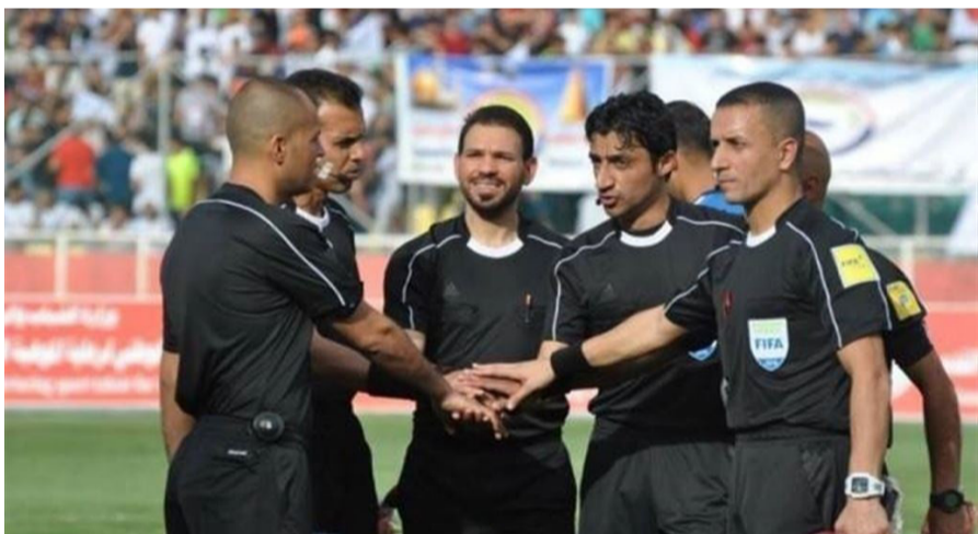
تكمية طائم نجوم العراق

بغداد- اسعد عبدها عبد علي يعتبر التحكيم احد عوامل النجاح والفشل في الرياضة، وفي لعبة كرة القدم بشكل خاص، الدوري العراقي كانت مشاكله مع التحكيم عميقة وكبيرة جدا، بسبب الهوة بين الحكم المحلي والتحكيم العربي والقاري، والعالي، بالإضافة لتشكوك الاحتراس لدواعي خاصة، وبوجه التحكيم العراقي تحديات كبيرة تؤثر على سير المسابقات المحلي وسمعة اقليميا، وعلى مستوى المنافسة وثقة الجماهير، لذلك نجد التحكيم العراقي مبعدا دائما من المسابقات الكبيرة، وهو دائما على الهامش، مما يعني عدم ثقة الاتحادات العربية والقارية والنائية بالحكم العراقي، لسعته حسيما، في بلده والأخبار المحلية تصل حتما، في هذا الموضوع سحاول القاء نظرة على المشاكل الكبيرة التي تواجه التحكيم المحلي في الدوري العراقي.