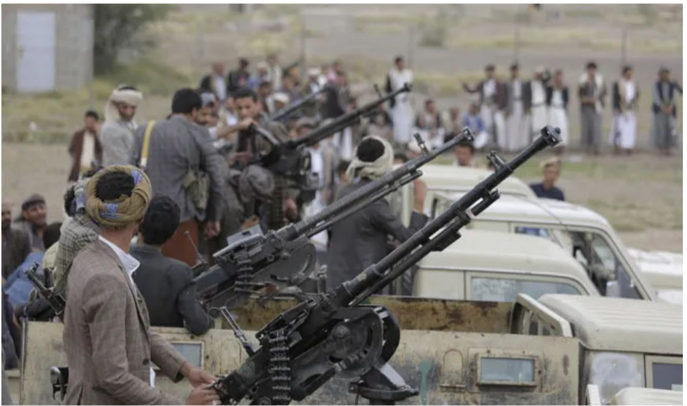
مقاتلون : حوثيون يتجمعون بعجلات مسلحة استعدادا لصد اي هجوم

وأعلن المتطرفون الحوثيون مسؤوليتهم عن الهجوم خلال الليل، وقالوا إنهم استهدفوا هذه السفينة "بدفة". وافادت وكالة "سبأ" الرسمية للأنباء بحصول غارات أميركية في منطقة صعدة التي يسيطر عليها الحوثيون في شمال اليمن وقال الحوثيون في بيان ليل الإثنين إنهم "سيكتفون" عملياتهم خلال شهر رمضان الذي بدأ الإثنين، دعما منهم لسكان قطاع غزة. وبيد الحوثيون منذ تشرين الثاني/نوفمبر استهداف سفن تجارية في البحر الأحمر وبحر العرب يشتبهون في أنها مرتبطة بإسرائيل أو متجهة إلى مواتها، قائلين إن ذلك يأتي دعما