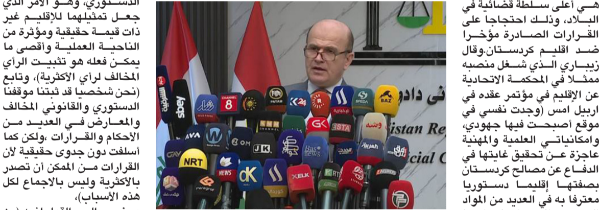
استقالة: عضو المحكمة الاتحادية قبل اعلان استقالته في مؤتمر صحفي

مناقشة - وزير الداخلية يتفقد مديرية المرور العامة مناقشة دخول الإشارة الضوئية الذكية