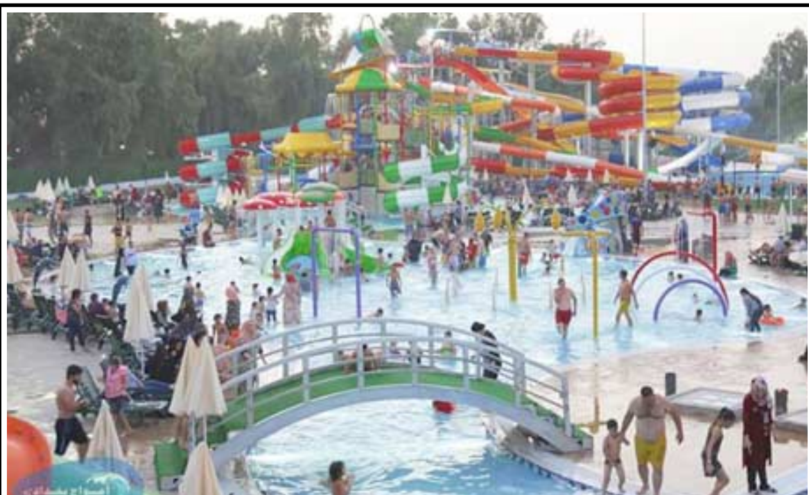
استجمام: عوائل تستجمع في جزيرة بغداد هربا من حرارة الجو

وراي رئيس الاقليم مسعود البارزاني ان من اسباب اجراء الاستفتاء هي انتهاء الشراكة في العراق . وقال بيان امس ان (البارزاني