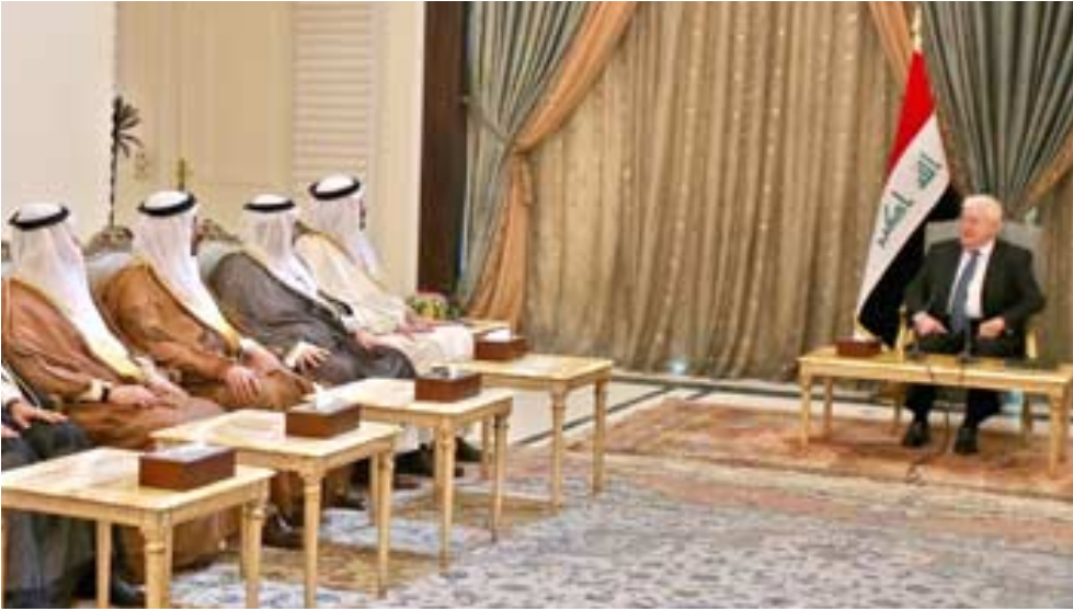
لقاء معصوم خلال لقائه مع الياور

لحزب الوفاق الوطني العراقي هاشم الحبيوي ومحمد خورشيد وعضو المكتب السياسي للحزب ضياء العريبي والأمين العام الدكتور المعيني في غضون ذلك، دعا المؤتمر الوطني العراقي أعضاء مجلس النواب الى إبعاد ملف الاستجوابات عن التسقيط والبروز السياسي.