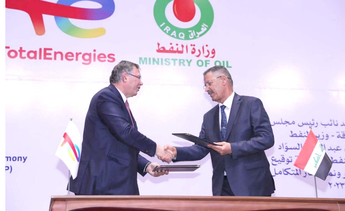
توقيع : وزير النفط يوقع مع شركة توتال الفرنسية اتفاق تنفيذ أربعة مشاريع للطاقة