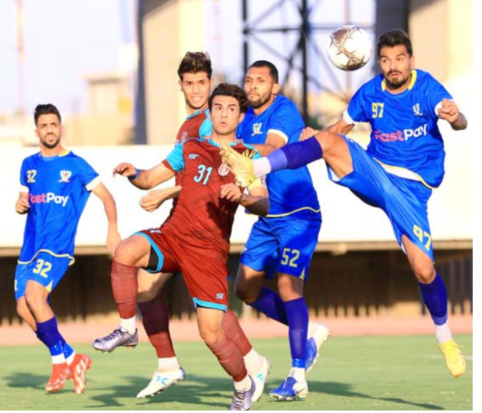
دوري: احدى مباريات الدوري الممتاز بكرة القدم