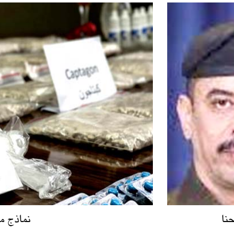
نماذج من المخدرات

وتخلق فراغات في السلطة تستغلها الشبكات لانخراف في أنظمة غير مشروعة، بما في ذلك الاتجار بالمخدرات. والأسبوع الماضي، أعلنت وكالة الاستخبارات والتحقيقات الاحادية حاصيلة عملياتها في العراق لمدة اسبوع، كاشفة عن ضبط أكثر من 257 ألف حبة مخدرات، والقبض على 303 تجار للمخدر، ويقول الأكاديمي في علم النفس والاجتماع احمد الذهبي لـ الزمان ان "ارتفاع مستويات الفقر والبطالة ومحدودية الفرص الاقتصادية في مناطق معينة من العراق يدفع الأفراد إلى الانخراط في إنتاج المخدرات او الاتجار بها او استهلاكها كوسيلة لتحقيق مكاسب مالية او الهروب من الظروف العصيبة.والخلافه الماضي، الفت الشرطة في نيوني