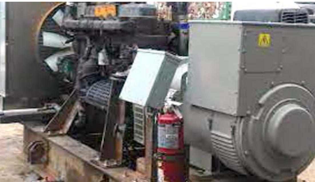
انتاج مولدة كهربائية من انتاج وزارة الصناعة