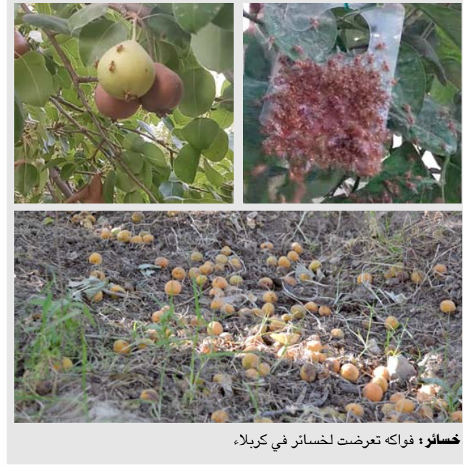
خسائر : فواكه تعرضت لخسائر في كربلاء