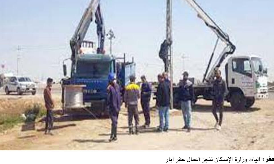
حفر: أليات وزارة الإسكان تنجز أعمال حفر أبار