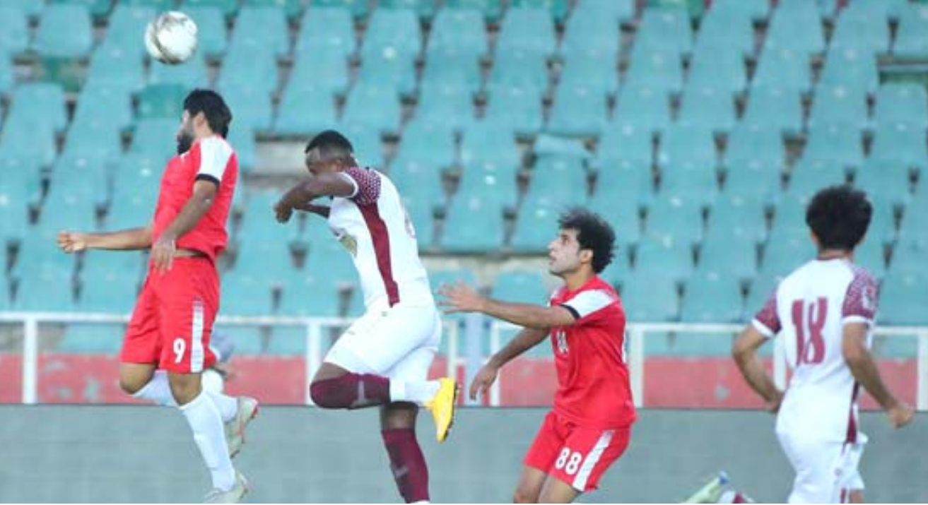
مباراة، جانب من مباراة الدوري العراقي لكرة القدم

المعتز كثيرا نطق الوسط في ديربي المدينة ويحاول اربيل التقدم سادسا لكنه سيكون امام اختيارا غايه في الصعوبة عندما يحل ضيفا على جبرانة نوروز الذي يريد إنهاء الموسم بنفس مركز المشاركة الأولى لكن اربيل الآن افضل من مضيفة. اما كربلاء ويامل الثامن كربلاء تحترق اربيل في مواجهة الاقليم لانقراض على مركزه السابع عندما يلتقي جبرانه الديوانافي ملعبه ويظهر مرشح للفوز للفوارق وافضلته كتنبيه حين عيوبوتظهر محاولتي الكرخ مع نطق البصرة والحدود مع الزوراء بنفس الرصيد 47 للفوز لتحقق.