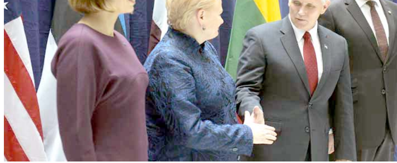
وصول: نائب الرئيس الأمريكي مايك بنس لدى وصوله أستراليا في زيارة رسمية

ويحسب المحللين المحليين، فمن المتوقع أن يقول للإستونيين ما يألون بسماحه، ولا سيما بعد الحوافر الناجمة عن تصريحات للرئيس الأمريكي دونالد ترامب التي شكك فيها في جدوى الحلف