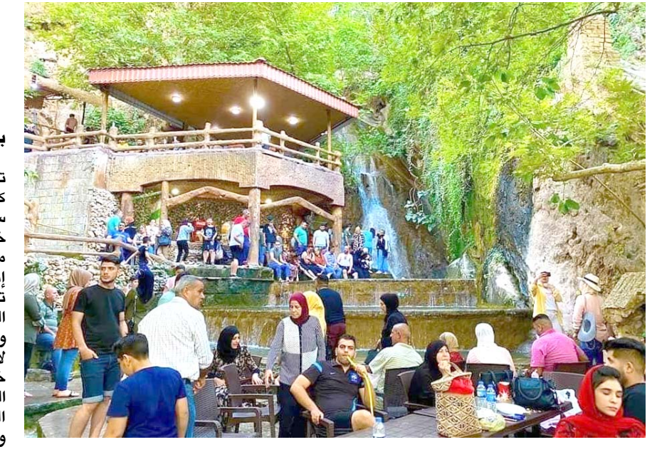
عيد: مواطنون من المحافظات يمشون أيام العيد في دهوك