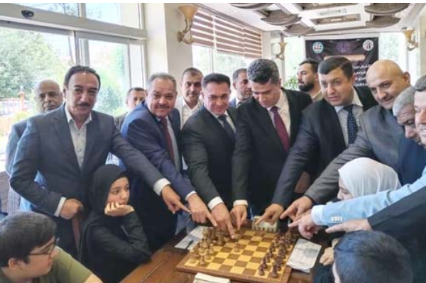
بطولة : حفل افتتاح بطولة العراق للفئات العمرية بالشطرنج