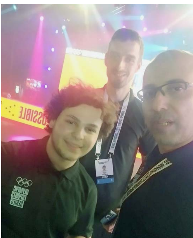
بطولة : جانب من حفل تأمير أولمبياد الألعاب الإلكترونية في سنغافورة