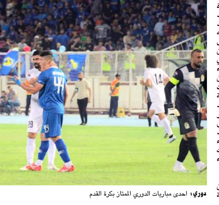
دوري؛ احدى مباريات الدوري الممتاز لكرة القدم