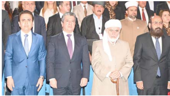
الربيل - فريد حسن

شدد رئيس حكومة إقليم كردستان مسرور البارزاني، على ضرورة تعزيز التعايش وقبول الآخر لنجد خطابات التحريض والكرهية التي تغير القلق. وقال خلال مناسبة اليوم الدولي لمكافحة خطاب الكراهية التي نظمتها وزارة الأوقاف والشؤون الدينية في الأقليم أنه (على امتداد تاريخ البشرية وإلى يومنا هذا، أدت الخطابات والشعارات العنصرية والتحريض على العنف إلى كوارث جسيمة، وحتى في عصر التقدم والتكنولوجيا الحالي، لا تزال هذه الخطابات مفعلة للقلق، إذ نرى عواقبها جليلة للعالم، فالحروب وأعمال العنف ما زالت تدور رحاها في العديد من البلدان والمناطق في العالم، وأضاف أن (كردستان على مر الزمان مركزاً للتعايش السلمي، وقد احتضنت منطقتنا هذه، منذ آلاف السنين، تنوعاً من مختلف القوميات والديانات والمعتقدات، وأصبح التعايش وقبول الآخر جزءاً لا يتجزأ من ثقافتنا ونمط حياتنا).