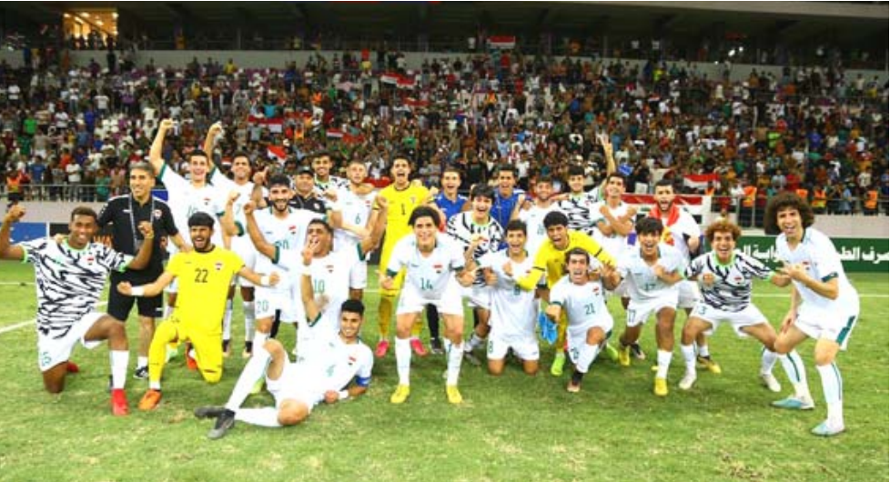
فرحة: فرحة الجمهور الرياضي ينتظر فرحة تأهل المنتخب الأولي الى المباراة النهائية لغرب آسيا

لكن إقامتها بعد اختتام دوريات المحلية شكل حملاً على اللاعبين خصوصاً وأن البطولة شهدت تداخل المباريات واللعب بين يوم وآخر والأغلبية قادمون من اختتام دوريات صعبة. في تنظيم خليجي 25 في البصرة كما تمت الاستفادة من تأهيل لاعبي كربلاء والمدينة بجهود ومتابعة شخصية من قبل وزير الرياضة احمد المبرقع في إنجازهما والاهم سيدخلان في استقبال اقامة مباريات الدوري واقامتها في المساء لوجود الإنارة وتجنب حرارة الأجواء وهمم أن ينهضي من الدوري والتوجهة للتحضير لاقامة دوري المحترفين والحذر واضح امام مشاركة بعض افضل لاعبي العراق في بطولة المناز الذي يفترض أن تتغير تسمية الى الدرجة الاولى امام تنظيم دوري المحترفين ولاندري كيف ستكون أمور مشاركة الفرق والكل تعاني مالياً وان لجنة