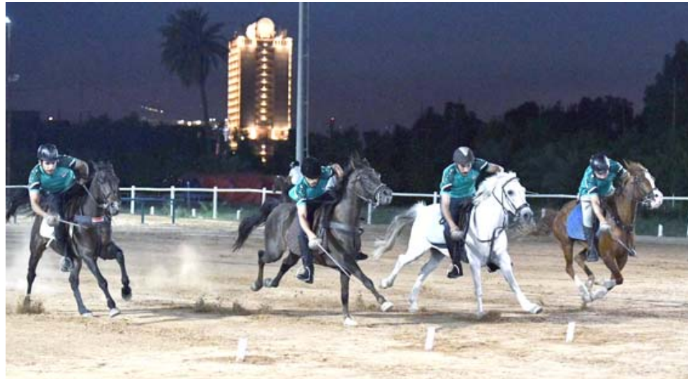
تدريب وحدة تدريبية للمنتخب العراقي للفروسية

الاستقرار الذي تحياها العاصمة وعن الوضع الحالي للعموم العراقي، وقدراته لإحتضان البطولات بمختلف الألعاب الرياضية وليس كرة القدم فقط. منافسات البطولة ولفت مفتن الى إنه إستورد عشرة خيول قفز أصلية عالية الجودة باهظة الأثمان لتدرب عليها فرسان المنتخب الوطني تمهيداً لامتنائها في منافسات البطولة الدولية المقبلة التي من المؤمل إنطلاق منافساتها في العاصمة بغداد في التاسع والعشرين من شهر ايلول المقبل. وعلى صعيد آخر اقامت اللجنة الانتخابية المكلفة بإجراء إنتخابات فروع اللجنة الأولمبية في المحافظات المؤتمر الانتخابي