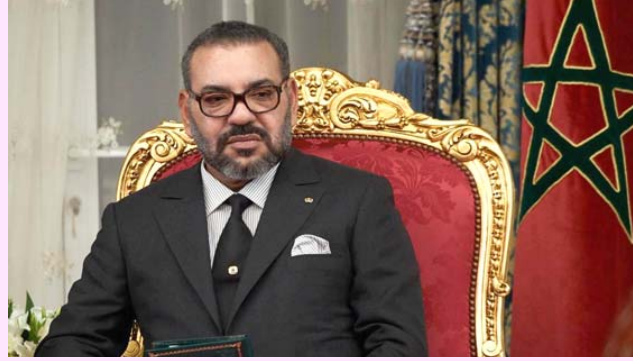
ملك المغرب محمد السادس

باعت الملك محمد السادس، ملك المغرب، برسالة تهنئة للمنتخب المغربي لكرة القدم للصالات، بعد تتويجه بلقب كأس العرب على حساب الكويت (1-7) في المباراة النهائية بالسعودية. ونقل اتحاد الكرة المغربي في بيان، رسالة الملك محمد السادس، والتي جاء فيه يسرنا ان نبعث لكم باحر التهنئة على هذا التتويج الخالص من نوعه على ارضنا، والذي يؤكد مجددا تالق وإشعاع كرة القدم المغربية بمختلف فئاتها وأصنافها في مختلف التظاهرات المحلية والقارية والدولية.