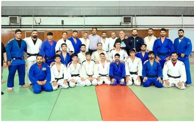
جودو: وفد المنتخب الوطني للجودو يستعد في طهران