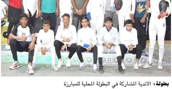
بطولة: الاندية المشاركة في البطولة المحلية للمبارزة