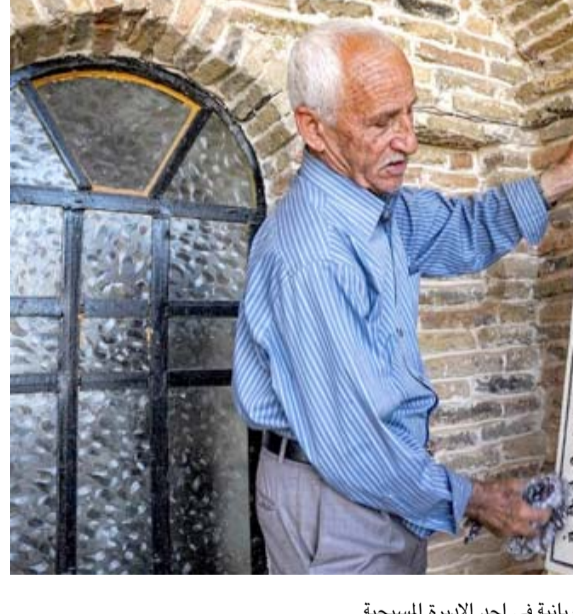
لوحة: رجل يقوم بتنظيف لوح باللغة السريانية في احد الابدية المسيحية