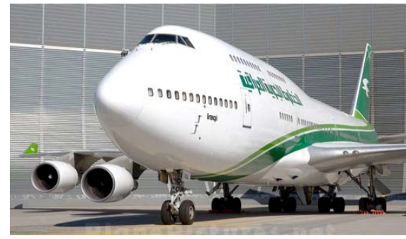
جوية: إحدى طائرات الخطوط الجوية العراقية