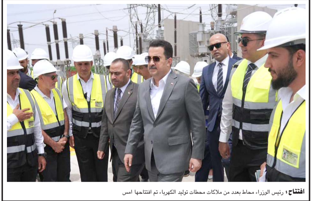
افتتاح: رئيس الوزراء محاط بعدد من ملاكات محطات توليد الكهرباء تم افتتاحها امس

اعلن الثلاثاء في جلسة علنية ان المحكمة حكمت بالاكثورية (بعد دستورية قانون استمرار الدورة الخامسة في برلمان كردستان العراق رقم 12 لسنة 2022) ويترتب على ذلك اعتبار مدة الدورة الخامسة لبرلمان الإقليم منتهية بانتهاء المدة القانونية المحددة لها وتعمل على ماسسة علاقاتها الداخلية والخارجية، ويسود التقرب والقلق في بغداد وأربيل من انعكاس قرار المحكمة على جو العلاقة بينهما، غير ان مؤسسات الديمقراطية تمثل إرادة الأولى شاناز إبراهيم أحمد