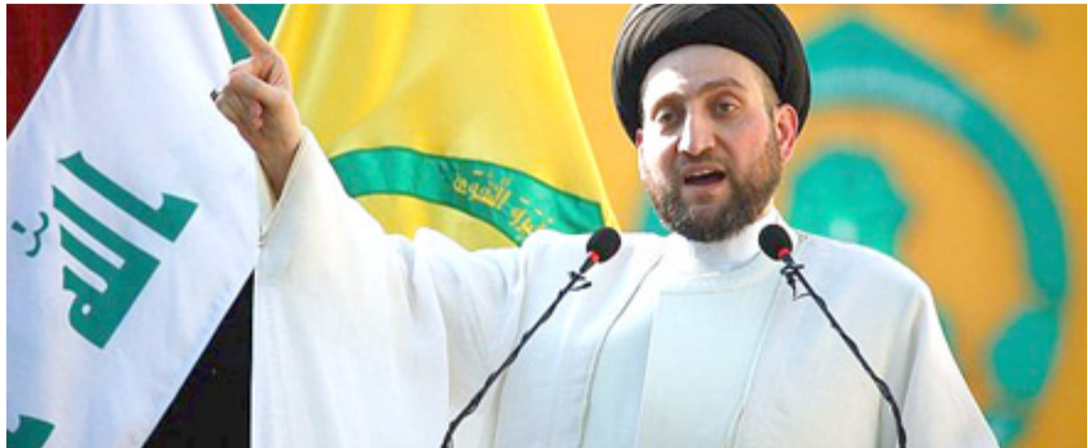
تبار: عمار الحكيم يعلن تأسيس تيار الحكمة الوطني

وطني جديد وإنفصاله عن المجلس الأعلى الإسلامي الذي خضنا معه ومع رجاله عمار العمل السياسي وتقسما الألام والأمال وانفقا واختلقت في وحدتها ومبادئها الأولى رضا الله تعالى وسخامته والشعب والمصلحة العامة. وأضاف البيان: وأضاف أن في الوقت الذي كنا نتمنى فيه أن يبقى المجلس الأعلى الإسلامي موحدًا متماسكًا، تفهم جيدا متطلبات المرحلة ودواعي التغيير والتحول التي تمثل علامات صدمة وتعاف في العمل السياسي برمته، فإننا نبارك للحكيم وتبارة الوليد هذا التأسيس وتابع أن هذا التأسيس الوليد سيحتمل هوم الوطن وأمال المستضعفين بين حذقاتها، سجدون في إخوتهم في كتلة الأحرار خير الداعمين وخير المتناصرين وأضاف كما ونحني الآخرة في المجلس الأعلى الإسلامي، ونؤكد لهم أننا في إخوتهم في كتلة الأحرار كان ومازال مستنيرا بتوجهات زعيم التيار الصدري مقتدى الصدر في لم الشمل ورض الصوف.