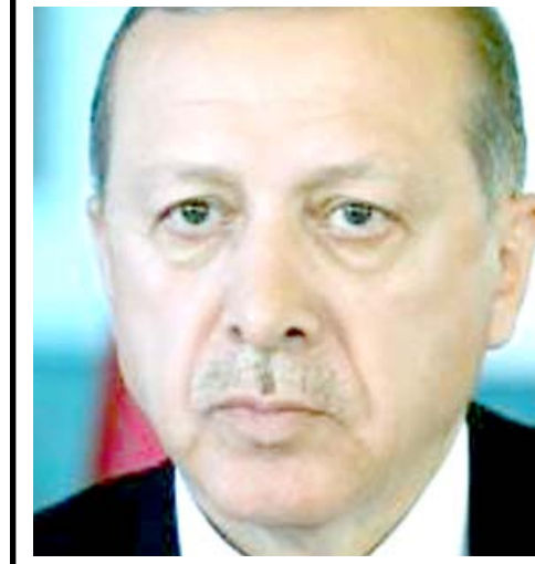
رجب طيب اردوغان