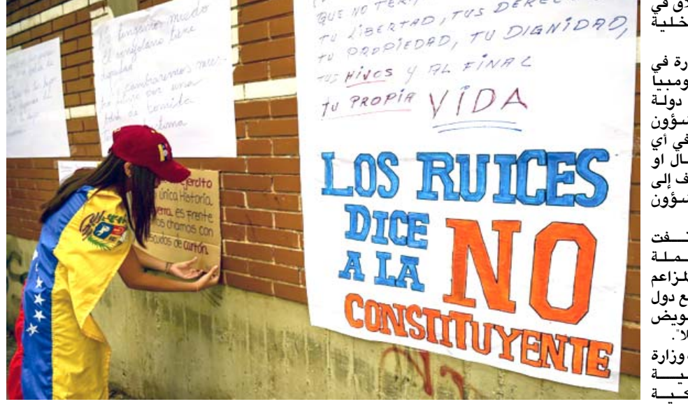
لافتات، تعليق لافتات معارضة للرئيس الفنزويلي مادورو على جدران العاصمة

وأضاف بل بالعكس، إنه (بريكست) يتعلق بالرغبة لإبقاء علاقات رائعة مع أصدقائنا الأوربيين وشركائنا ... (وفي