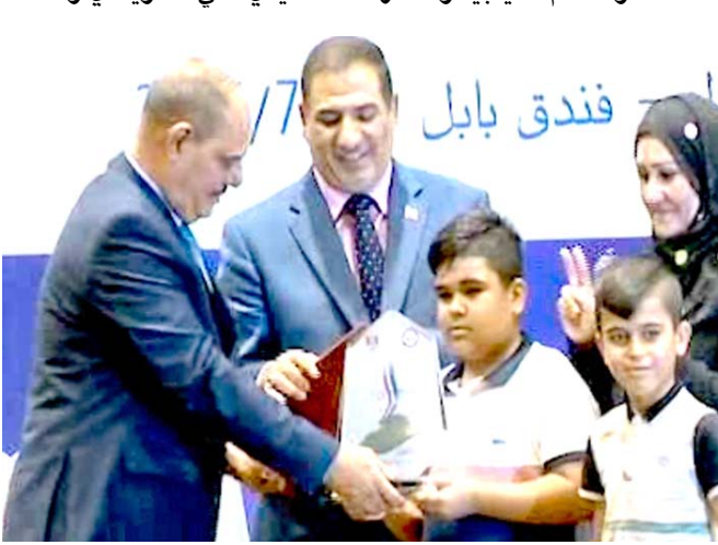
توزيع الهدايا بين عوائل شهداء الاعلام

رئيس الوزراء وأعضاء من لجنة الثقافة والإعلام النيابية والإدارة