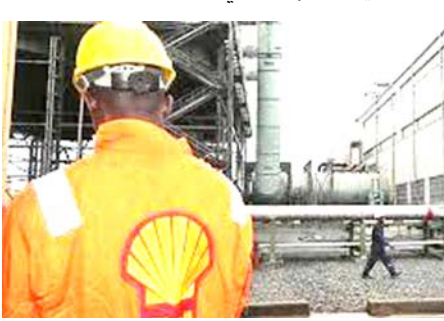
مبنى شركة شل