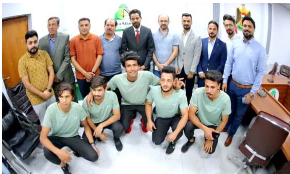
تكريم: مافذي قار يكرم لاعبي اندية المحافظة لانجازاتهم المتحققة

ويعود المحافظ خلال لقائه الفرق من أندية المحافظة بتقديم كل وسائل الدعم الممكنة وتوفير اراضي استجمامية للنادية تمكنها من تعزيز الجانب المالي وبما يدعم ادارة اشغالها وشمل التفتيش فريق نادي الغراف بمناسبة تأهله لدوري الطائفة المحزان وفريق نادي اهور الجياش لكرة الطائرة بمناسبة تأهله الى الدوري الممتاز ولاعبي فريق نادي الناصرية بمناسبة تأهله للمباراة النهائية لكرة السلة. للدرجة الاولى ولاعبي نادي الفرات لكرة القدم بمناسبة تأهله للدور الثاني.