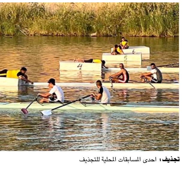
تجهيز: احدى المسابقات الحلية للتجديف

بغداد- الزمان وقع الاتحاد العراقي المركزي لكرة القدم تدريبياً مع المدير لوي صلاح