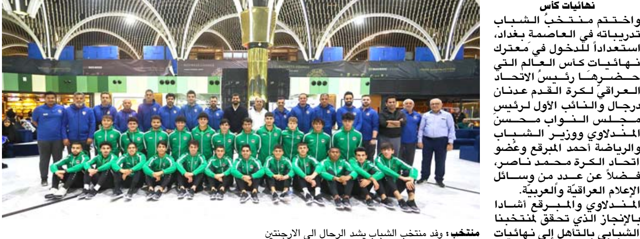
منتخب: وفد منتخب الشباب يشد الرحال الى الأرجنتين

بغداد- الزمان وقع الاتحاد العراقي المركزي لكرة القدم تدريبياً مع المدير لوي صلاح