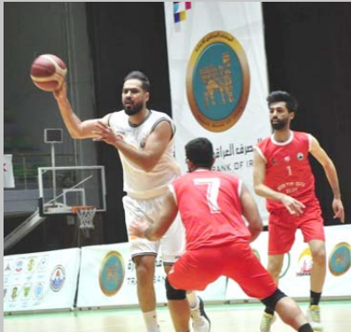
بغداد - الزمان فاز فريق نادي زاخو، على فريق نادي الحشد الشعبي بنتيجة 88-90 نقطة في مباراة تحديد المركزين الثالث والرابع لدوري السلة الممتاز للموسم 2022-2023. وكان فريقا النقط والشربة تأملا إلى المباراة الخامسة بعد فوز الشرطة على الحشد والنقط على زاخو ناشئين الحشد الشعبي يتوجون بلقب الدوري المصاحب لكرة السلة من جهة أخرى توج فريق ناشئي الحشد الشعبي لكرة السلة بالمركز الأول لدوري المصاحب لدوري العراق لكرة السلة للمرحلة الأولى بعد انتابهم جميع المباريات بدون أية خسارة وجاء التتويج في الحفل الذي أقامه اتحاد كرة السلة المركزي مساء، اليوم الاثنين في الاستراحة ما بين الشوطين لمباراة فريقَي الحشد الشعبي وزاخو.