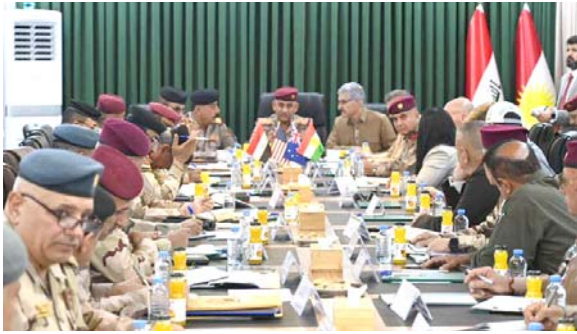
الحفاظات - مراسلو (الزمن)

بغداد - ضباط من القوات المشتركة والبشمركة في اجتماع بالسلامية، وافقت قيادة العمليات المشتركة، مع قوات البشمركة على تفعيل اللجان والتعاون لتعزيز الأمن في مناطق الإهتمام المشترك. وقال نائب قائد العمليات المشتركة الفريق الركن قيس الحمداني في مؤتمر مشترك بمحافظة السليمانية (عقدا اجتماعاً مع قائد قوات السبعين مصطفى جاورش، لغرض إدامة وديمومة التنسيق الفعال المختر على الأرض وتبادل المعلومات وتنفيذ الخطط المتعلقة بتفعيل اللجان ذات العلاقة والتعاون المستمر على جميع المستويات في مناطق الإهتمام المشترك). وأضاف أن (توجيهات القائد العام للقوات المسلحة واضحة بهذا الصدد، وهو أن تكون القطاعات واحدة ومصيرنا مدمناً واحداً). ولتقت مفازين من إلقاء القبض على 31 متبراً خلال شهري نيسان الماضي وإبرار الجاري، حيث كانت الحصيلة الإجمالي في محافظة نينوى، وتم القبض على 13 منهم بالإبزاز في مركز المدينة وغربها، مؤكداً أن (مفازين الجهاز في محافظات كربلاء والأنبار والمثنى والبصرة وبابل، اطاحت بنحو 18 متبراً بعد نصح كمائن محكمة لبعضهم). ونجحت مديرية مكافحة إجرام بغداد، في القبض على عصابة سرقت أموال ومصوغات ذهبية ببغداد. وقال بيان تلقته (الزمن) أمس أن (طقس اليوم الأربعاء سيكون درجات من اليوم السابق في عموم البلاد، حيث تسجل العظمى في بغداد 34 مئوية)، وتابع أن (طقس يوم غد الخميس سيكون غائماً جزئياً مع فرصة لتساقط زخات مطر خفيفة ومتفرقة بعد الظهر في جميع مناطق البلاد، ودرجات الحرارة سترتفع قليلاً عن اليوم السابق).