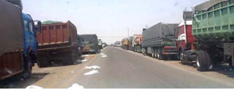
تسويق : شاحنات تسوق الحنطة

في هذا الموسم تبشر بالخير والإنتاج الوفير لدعم السلسلة الغذائية للمواطنين بالحصائل المحيطة بالزراعة لمحافظته ميسان ارتفعت المساحات الميمية والتي تأثرت من شحة مياه الري في بداية الموسم الزراعي.