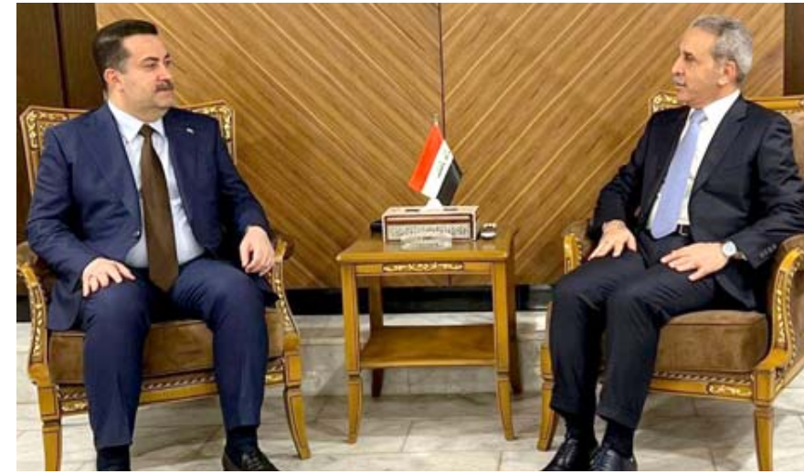
لقاء: رئيس الوزراء والقضاء الأعلى خلال لقائهما الخميس الماضي

منعت سلطة الطيران المدني التابعة لوزارة النقل، مركبات الأجرة الصفراء وخاصة نوع السابيا من الدخول إلى مطار بغداد. وقال المتحدث باسم السلطة جهاد كاظم في تصريح أمس إنه (من اليوم السبت سيجتاز المطار لمدة 24 ساعة، وبإمكان المسافر أن يضع سيارته قرب المطار المخصص بقدر ما يريد، مقابل أجرة مقدارها 10 آلاف دينار للرسوم الواحد)، وأضاف أنه (بإمكان أي مركبة الدخول إلى المطار على أن تكون لدى السائق سخوية مسجلة باسمه)، مؤكداً (عدم صحة ما يشاع بأن يكون السائق من الدرجة الأولى، بل بالإمكان الاستعانة بأي سائق خصوصي على أن تكون السيارة صفراء وخاصة مركبات نوع (السابيا)، واستطرد بالقول (السموح لهم فقط المسافرين المغادرين، ولاحفاً ستعمم التجربة على المسافرين الوافدين الذين يسمح لهم حالياً