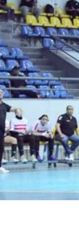
يد - جانب من مباريات دوري اليد المصري للنساء