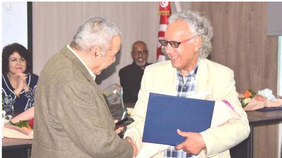
حفل جانب من حفل توزيع جائزة بكار للرواية

الكثير من الأموال (مع أننا بلد غني)، بل يحتاج إلى إصرار وإرادة قوية وحرص على الإبداع من القائمين على الشؤون الثقافية العراقية وصنع القرار الثقافي العراقي، إنها دعوة صادقة نأمل أن تجد صداها عند من يهتمو أمر الثقافة والأدب الروائي بشكل خاص عراقياً وعربياً. أخيراً إلى دقة وجمال التنظيم من لحظة وصول الضيوف إلى مطار تونس، واستقبالهم بشكل لائق وكريم، وكانت هناك جولات إرشادية تعرف الضيوف بالمدن الثرية والسياحية الجميلة في تونس مثل مدينة سيدي بن سعيد وبزرت وخلق الوادي وغيرها، في رقة غاية بالنفاز والجمال، تخللتها فعاليات مسرحية وموسيقية وإعلامية وترفيهية مشرفة، لقد مرت تلك الأوقات بسرعة الأحلام الورديّة، ولم يبق منها سوى الذكرى، ووجب الشكر أن يجعل بيد في خدمة الثقافة والسفن والأدب والإنسانية عربياً وإقليمياً.