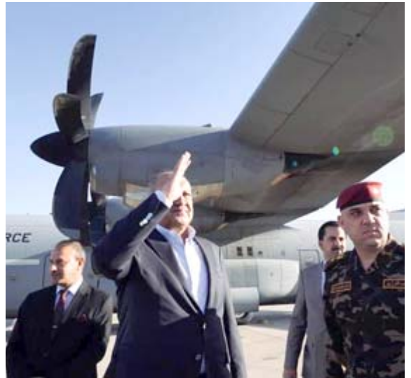
استقبال: وزير الدفاع يستقبل طائرة إخلاء العراقيين من السودان

اضافت إحدى الإسهات أن (نجلتها في سجنين مختلفين، يسمح لها برؤية أدهم مرة كل 4 أشهر)، مؤكدة أنها (تقوم بجمع الأكياس والظروف من الثغابيات ويعيها لتأمين مصروفها داخل السجن)، وأشارت إلى أن (أحد ابناتها منسحب في القوات الأمنية وشارك في الحرب ضد داعش، اعتقل مع أخيه بتهمة التسلب، وحكم على أحدهما بالسجن 20 عاماً وعلى الآخر 15 عاماً)، وشكت سوء الحال بذكرها أن (ولدي متزوجان ولديهما خمسة أطفال، وأبوهما مريض، وأنا اضطر إلى الاستجداء أحياناً لتأمين احتياجاتنا)، مطالبة (بالعفو عن ولديها)، من جانبها، أكدت امرأة ناشئة عن غبتها، بسبب تعرض أبنائها التي تحمل صورته ببديها إلى الظلم، وقالت (أبني لا تدخل له بشيء، اعقلوه مصابياً، وأصدروا بحقه الحكم بالسجن المؤبد بعد إدانته بجرمته (قتل). كما طالبت إحدى المختجات المنظمات بر(الوقوف إلى جانبهم ومساندتهم، وإصدار عفو عام عن ما وصفته مقرة (الأحياء).