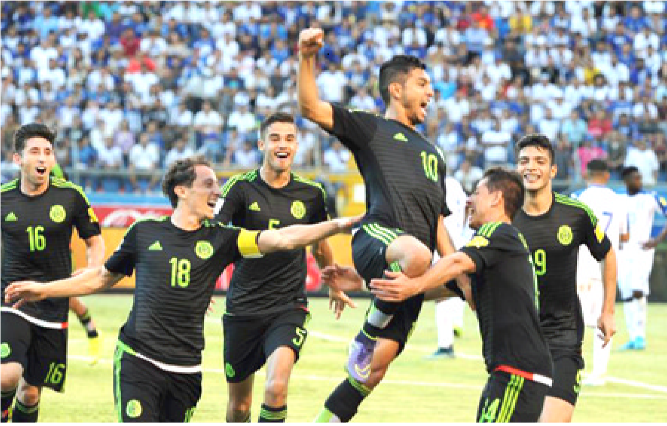
تاهل: يصل منتخب المكسيك إلى المباراة النهائية وتغلبه لنيل لقب البطولة الذهبية