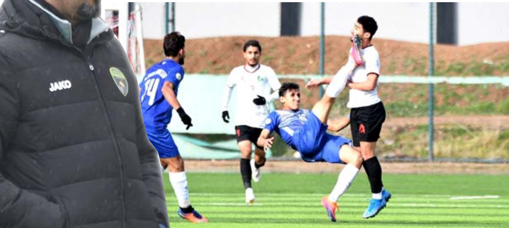
مربي فريق نبط البصرة

المتمسدة بخوض المواجهة بأفضل مستوى من سابقاتها ويريد أن يتقدم خطوة باستغلال قدرات وإمكانات التشكيل لأن اللعب في العاصمة شيء آخر مع الرغبة في الظهور لمواصلة التآلق خارج البصرة والبحث عن تعويض خسارة الأسبوع الماضي وتخطيط عبد الوهاب ابو الهيل لعبور المواجهة ضد المنتخب المتخبط بلاعبين المنتخبين وإيقاف انتصاراته عبر التعويل على انتفاضة الطريقة التي يمكن ان تحقق الفوز ويأمل ان لا يخيب ظنه وهو الذي يدير الفريق على أفضل ما يرام لكن ما زال بانتظار الكثير.