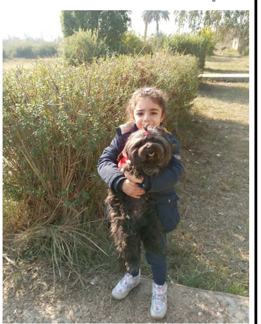
حياة ، مناظر من الحياة اليومية للديوانية

في نهر الفرات من الحلة الى البصرة وجاء في كتابه ( مطالع السوء المختصر) ذكر الديوانية بعد ان ساق صاحب الكتاب حديثه في خروج الوالي سليمان باشا لتأديب زراعة لانها اظهرت العضيان، فقال: فلما نزل الوالي بعسكره غربي الفرات مقابل الديوانية خافت منه قبائل زراعة مقر العشيرة الخزاعية الريفضية علما ان اسم محافظة الديوانية جاء من ديوان - المضيف- شيخ قبيلة خزاعة الشيخ حمود ال عباس رئيس الخزاعل وتسمى ايضا (الديار الخزاعية) اما تسمية محافظة القادسية فهو مشتق من معركة القادسية الاولى بين المسلمين والفرس في ايران!