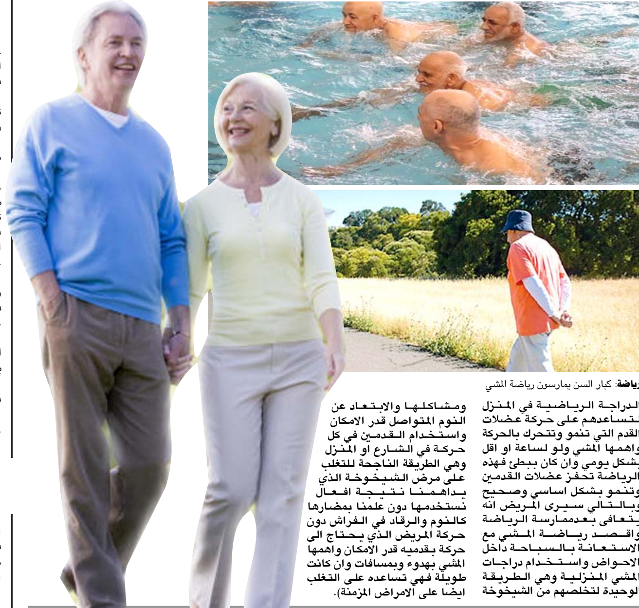
رياضة كبار السن يمارسون رياضة المشي

مشاكلها والابتعاد عن النوم المتواصل قدر الامكان واستخدام القدمين في كل حركة في الشارع أو المنزل وهي الطريقة الناجحة للتغلب على مرض الشيخوخة الذي يداهمنا نتيجة افعالنا المستخدمة دون علمنا بمضارها كالنوم والرقاد في الفراش دون حركة المريض الذي يحتاج الى حركة بقدমে قدر الامكان واهمها المشي ببدء ومسافات وان كانت طويلة فهي تساعد على التغلب ايضا على الامراض المزمنة.