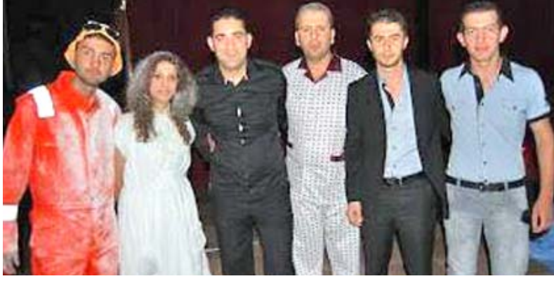
مسرحيات: مشاهد مسرحية لهدير كوندرا