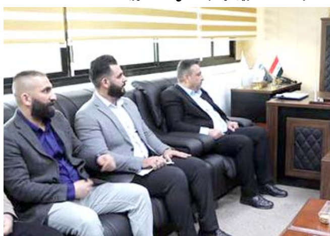
اجتماع و وزير النقل يجتمع بملاكات الوزارة

وزير النقل، رزاق محسيس السعدوي ، الشركة العامة لخدمات الملاحة الجوية في مطار بغداد الدولي ، للاطلاع على سير العمل في الشركة. وبحسب البيان فإن (السعدوي شد على ضرورة تعزيز التنسيق المشترك بين تشكيلات الوزارة والخطوط الجوية، والملاحه الجوية على وجه الخصوص، من اجل ديمومة العمل والإرتقاء نحو الأفضل، بما يخدم المصلحة العامة)، وأشار الى (مقترحات الموظفين التي قدموها للوزير، في مجال تحسين الخدمات التي تقدمها الشركة لجميع شركات الطيران الدولية)، موجهاً السعدوي (التنسيق الدائم مع المنظمات الدولية للطيران المدني، لديمومة العمل والإستمرار في تحقيق النجاح وسلامة وامان إدارة الحركة في الفضاء الجوي)، ونظمت الشركة العامة لسكك الحديد، إحدى تشكيلات الوزارة، حملات ميدانية لصيانة وتأهيل خطوط ومفاصل سكك القطار، وذكر بيان امس ان (الحملة تضمنت صيانة وتأهيل خطوط سكك محيط محافظة نينوى، لتأمين المعابر غير النظامية في المنطقة)، وأوضح ان (ملاكات الهندسة المدنية الوسطى، واصلت حملاتها المستمرة بتأجير اعمالها الخاصة بصيانة وتأهيل خطوط سكة ابي غريب والكاظمية والساجي، فضلاً عن ازالة التجاوزات على خطوط السكك)، و اضاف ان (الشركة قدمت عدة دعاوى من قبل لجنة مركزية متخصصة برقع التجاوزات على محرمات الشركة في وقت سابق)، على صعيد متصل، اتخذت الشركة العامة للموائئ، اجراءات لتحديد