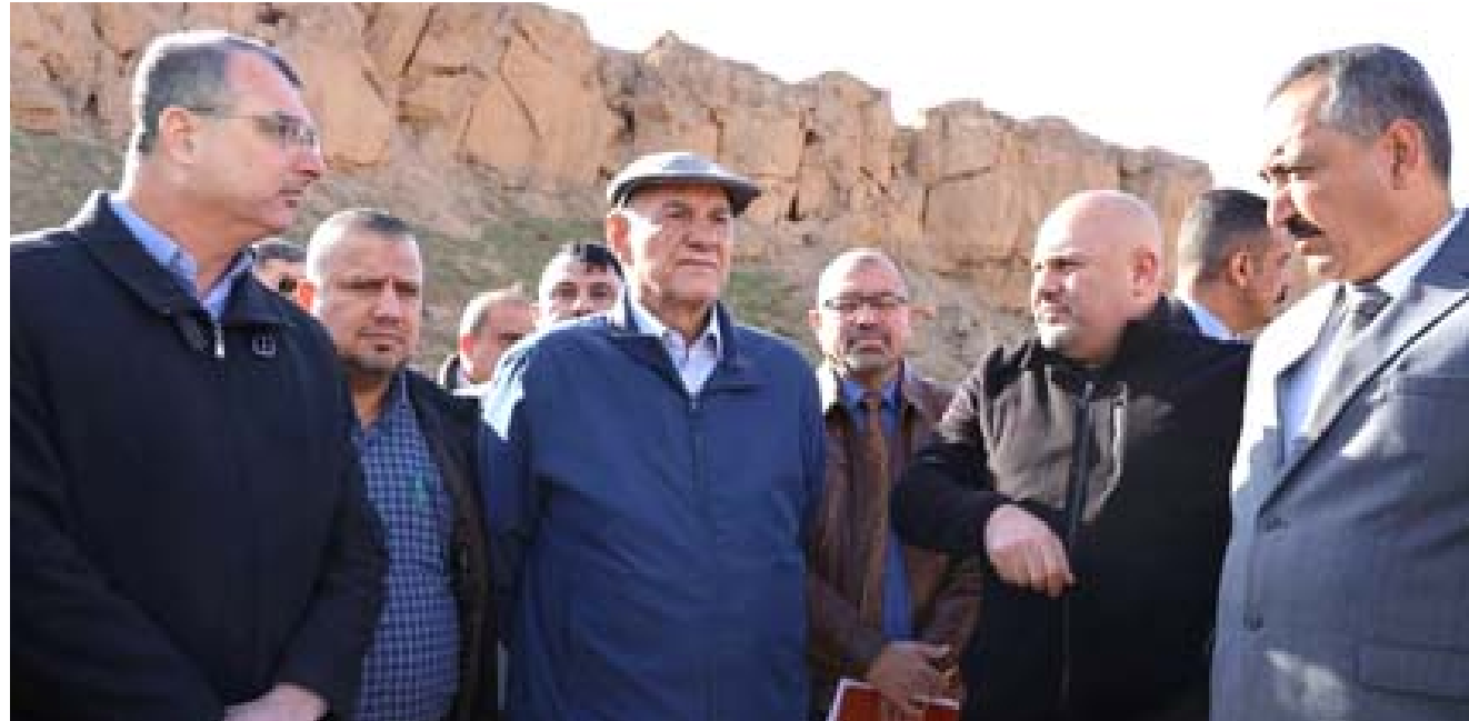
زيارة وزير الموارد المائية خلال زيارة تفقدية

مستشاراً إلى (تجاوز عدد من المواطنين الخبزاء، موضحاً أن (هذه المساحات تمثل ضماناً زراعياً مستقبلي للعراقيين جميعاً، باعتبارها ثروة وطنية لا يمكن التفريط بها بأي حال من الأحوال).