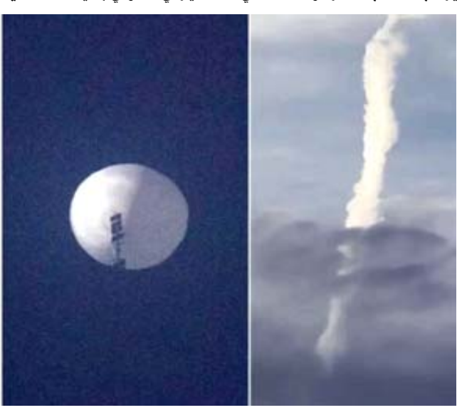
منطاد، صور للمنطاد الصيني قبل وبعد إسقاطه

من جهة، قال زعيم الديموقراطيين في مجلس الشيوخ تشاك شومر عبر تويتر السبت ألقى بقيادة الرئيس بايدن لإسقاط المنطاد الصيني فوق المياه حفاظاً على سلامة جميع الأميركيين. وأضاف الآن يمكننا جمع المعدات وتحليل التكنولوجيا المستخدمة من الصين على صعيد متصل، أكد البنتاغون الجمعة أن منطاداً صينياً شاتياً رصد أثناء تحليقه فوق أميركا اللاتينية. وقال مسؤول أميركي كبير السبت مرت مناطق مراقبة صينية لفترة وجيزة فوق الولايات المتحدة ثلاث مرات على الأقل خلال ولاية الإدارة السابقة، ومرة واحدة في بداية ولاية هذه الإدارة على حد علمنا، ولكن ليس لهذه المدة الطويلة.