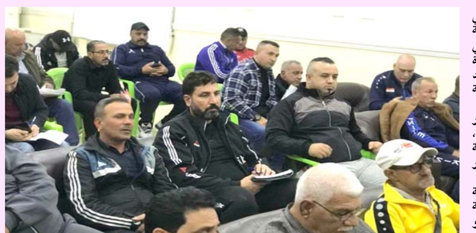
اجتماع، جانب من الاجتماع التحضيري لاتحاد الملاكمة