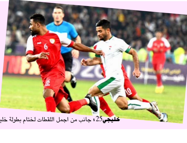
خليجي 25؛ جانب من اجمل اللحظات لختام بطولة خليجي 25