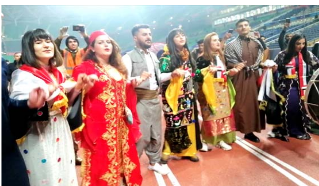
ملعب: فعالية موسيقية في مدينة البصرة على ملعب جذع النخلة

الزمان - السنة الخامسة والعشرون العدد 7489 الإثنين 1 من رجب 1444 هـ 23 من كانون الثاني (يناير) 2023م