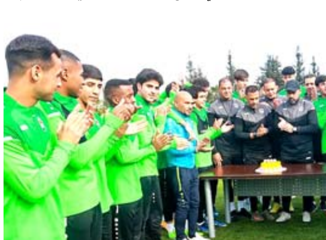
تدريبات: جانب من تدريبات منتخب الشباب في تركيا

الذي فاق كل التوقعات، وأدى إلى تاخر دخول الجماهير العمانية الحبيبة إلى الملعب لمؤازرة المنتخب الوطني العماني في المباراة النهائية لبطولة خليجي البصرة 25. وبهذه المناسبة، يتقدم رئيس