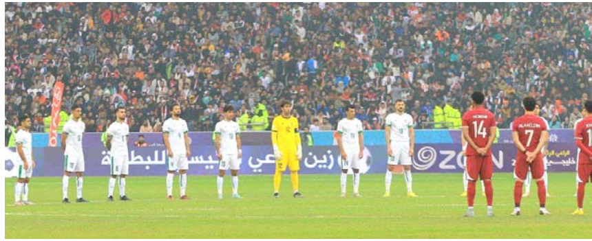
حداة : فريق العراق وقطر في وقفة حداد على ارواح المشجعين الذين قضاوا في الناصرية. عسة قحطان سليم

النهائي خليجي 25? تعدهم الله برحمته الواسعة واسكنهم الفردوس. وقال امس (الوزير) ، وقال في بيان امس (التعازي لذوي الطوقين بحادث حاصلة حادث المشجعين على الرابط بين المحافظتين) ، داعياً الجهات الصحية التي تقدمت الرعاية الطبية والرعاية اللازمة (للجرحى). كما شاطر الاتحاد العراقي لكرة القدم، عوائل ضحايا الحافلة الاجزائ، وقال في بيان تلقته (الزمان) امس ان (رئيس الاتحاد عدنان درجال، يتقدم باحر التعازي واصدق المواساة لعوائل الضحايا الذين نهوا ضحية حادث مروري اثناء سفرهم من الناصرية الى البصرة لمشاهدة مباراة المنتخب امام شقيقه القطري التي اقيمت امس، ضمن التور نصف