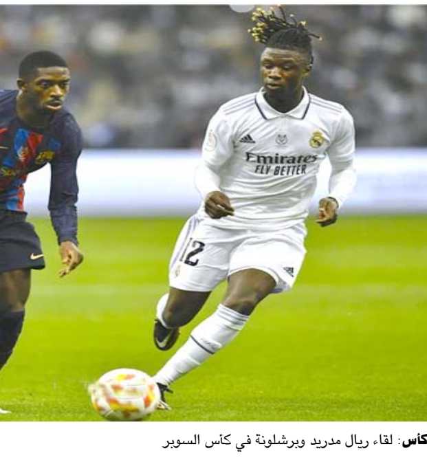
كاس : لقاء ريال مدريد وبرشلونة في كأس السوبر