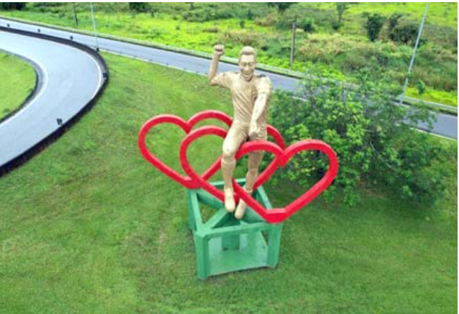
تمثال لبيليه وسط ساحة

حيث ولد قبل 82 عاماً "معجزة كرة القدم" يتجول عشاق الأيقونة الكبرى اللاتزال ببلو هوريزونتي وساو باولو وريوي دي جانيرو، وتحيط بها مزارع البن تعود لشهرة المدينة إلى حقيقة واحدة: ولادة إيسون أرانتيس دو ناسيمينتو المعروف ببيليه في عام 1940. بدأ بيليه مسيرته الكروية في سن المراهقة في نادي سانتوس، بالقرب من ساو باولو، حيث يوجد متحف خاص به والذي يعرض غالبية ذكرياته. في ترينس كوراسوينس، أدى تفاقم مرض بيليه إلى جلب المزيد من الزوار إلى منزله، وهو نسخة طبق الأصل من منزله الأول. الواقع في شارع شديد الانحدار، فيه منازل صغيرة، ويحمل اسمه. قال نيلور انهيجي، الجار البقال 41 عاماً، لوكالة