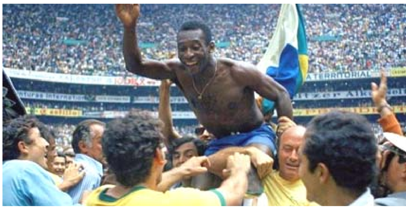
اكتشافه : بيليه محمولاً على الأكتاف بعد فوز بمباراة

ساو باولو- (ا ف ب) - توفي البرازيلي بيليه، أسطورة كرة القدم العالمية والمهاجم العبقري الذي أحدث ثورة في عالم المستديرة، الخميس عن 82 عاماً، بحسب ما أعلنت عائلته. وكتبت ابنة الملك كييلي ناسيمينتو على إنستغرام من مستشفى البرت انشعابين حيث كان يعالج بيليه من مرض السرطان منذ شهر تشكر. نذكر بلا حدود. ارقد بسلام. اختير بيليه، اللاعب الوحيد المتوج بكأس العالم ثلاث مرات (1958 و1962 و1970) أفضل رياضي في القرن الماضي من قبل اللجنة الأولمبية الدولية عام 1999. ويعدها بعام كأفضل لاعب في القرن عينه من قبل الاتحاد الدولي لكرة القدم (فيفا) بشكل وفاته صدمته لعشاق كرة القدم حول العالم. بعد أيام من انتهاء مونديال قطر 2022 حيث ودعت البرازيل من ربع النهائي أمام كرواتيا بركلات الترجيح: أجلبوا الكأس إلى البيت، هكذا نشر الحساب الرسمي لبيليه على مواقع التواصل الاجتماعي، يوم المباراة الأولى للبرازيل أمام صربيا 2-0 خسرها بيليه بمعركته الأخيرة مع سرطان القولون المكتشف في 2021. وخلال فحوص روتينية يعثره فرق اعظم لاعب كرة قدم في كل العصور. هل الضحك ويعد هذا المرواح الفكاه الذي ساهم بولادة كرة الساسيا "مخاطبة كعز وطني في البرازيل. هي الضحك الذي يبلغ عدد سكانها 75000 نسمة، بخفا عن ذكريات نادرة لبيليه، الذي ولد هناك لعائلة فقيرة وقضى السنوات الأولى من حياته من شهر تماما منذ دخول بيليه مستشفى البرت انشعابين في ساو باولو، حيث يخضع للعلاج الكيميائي لسرطان القولون منذ نهاية عام 2021. تفاقم حالة في آخر بيان لها قبل ثمانية أيام، أشارت المستشفى إلى تدهور الحالة الصحية لبطل العالم ثلاث مرات اثر تفاقم حالته السرطانية ومضاعفاته من مشاكل في الكلى والقلب. تقع ببلدة ترينس كوراسوينس الصغيرة والنتي