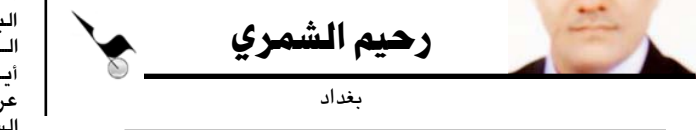
رجم شمري بغداد