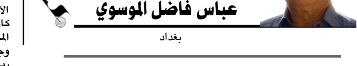
عباس فاضل الموسوي بغداد

في صيف العام 1986 نظمت المكسيك واحدة من أقوى بطولات كأس العالم بكرة القدم بمشاركة عراقية يتيمة حتى الآن محبو كرة القدم بتكثرون جيدا المباريات الكبيرة التي تقام في الأرجنتين والمانيا وفرنسا والبرازيل وبلجيكا... بما لم نقرأ أي بطولة عالمية أخرى كما أفرزت تلك البطولة من الأضواء قدامى باللون الخمس، وتعد أكبر دولة بمحورديتها لهذا الخميس غير معني بتاريخ البطولة الكروية ولكن هناك صورة دالها مستخدمو الفيديوكام فرضت هذه المقدم، الصورة تضم نجمين تلقا في تلك البطولة عالميا الداعية الأرجنتيني ديغو مارادونا والبلد الفرنسي ميشيل بلاتيني، الصورة تشير إلى لقاء المنتخب الفرنسي والأرجنتيني للتصميم فإن المنتخبين لم يلتقيا في تلك البطولة إذ لعبت الأرجنتين النهائي مع ألمانيا وانكفت فرنسا باللعب على المركزين الثالث والرابع بعد أن اقتصد البرازيل المتعة بالنجم وفي ظل وجود حملة اعنابية وإصلاحية للمنتج ارتدى كل من الفرنسي ميشيل بلاتيني قميصا مكتوب عليه (لا للفساد) وارتدى الأرجنتيني ديغو مارادونا قميصا مكتوب عليه (لا للخور)، المشكلة الأكبر أن مارادونا أمن تعاطي المخدرات وأن ميشيل بلاتيني خرج من رئاسة الاتحاد الأوروبي بأكبر قضية فساد في تاريخ كرة القدم، ربما سألتمه من رجال المخابرات عندما بعد العام 2003 الذين لم تنتهي به بطولتهم الكروية فالعالم مفتوح لكل ويبدو أن المباريات تجري بدون حكام العالم يتحرك بدون خطوط حمراء ولا تيجان روس ؟!