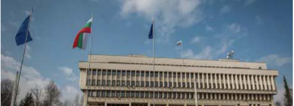
حارجية : وزارة الخارجية البلغارية في صوفيا

القت وزير الخارجية البلغاري، قالت السفارة الروسية في بيوترافانوا لإ معلومات لديها بشأن الاتهامات الموجهة إلى غروزيف، وأضاف أن موقع وزارة الداخلية الروسية لا يصف قط القيم المحددة الموجهة للأشخاص المطلوبين، وتابعت أن غروزيف مطلوب في الأراضي الروسية وحدها ويستعين على بلغاريا السعي للحصول على مزيد من المعلومات مباشرة من وزارة الداخلية الروسية وسخر غروزيف من تصريحاتها في توير بعدما سخر للحكومة البلغارية بفاعها عن غير طرح أسئلة صعبة على الكرملين.