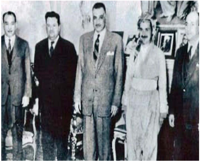
جلال طالباني بالزي الكردي يلتقي جمال عبد الناصر

للقضية الشعب الكردي في فرنسا والمانيا وروسيا وشيقتو فواليا وكوسا. في عام 1972 اسافر الى خارج العراق وبقي لفترة في مصر ولبنان وسوريا. وعقب انهيار الثورة الكردية التي انتهت في 2٠٠٣، وترأس المجلس في تشرين الثاني 2٠٠٣ عندما صارت رئاسة المجلس الشابي وسبب التسليم للجزبي لاسماء اسس السليمانية الاتحاد الوطني الكردستاني في حزيران الاوّل من حزيران عام ١975 في دمشق ومن ثم خبط للثورة لكي تتعدل من جديد في 1976-1-6 واصبح سكرتيرا عاما للاتحاد. خلال الثمانينات والتسعينات كان الطالباني معارضا شديدا لنظام صدام العربي في بغداد التي خلفها نوري المظفر في عام ١96١ في بغداد التي خلفها ضد عدو الكريم قاسم ودفاعا عن الملا مصطفى البارزاني إذ كان قاسم يسند اليه مجموعة تهم، ونتيجة ذلك صرح بقره الفقيض المعارضة واخرها مؤتمر لندن في كانون