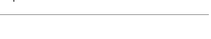
يونس حمد اوسلو