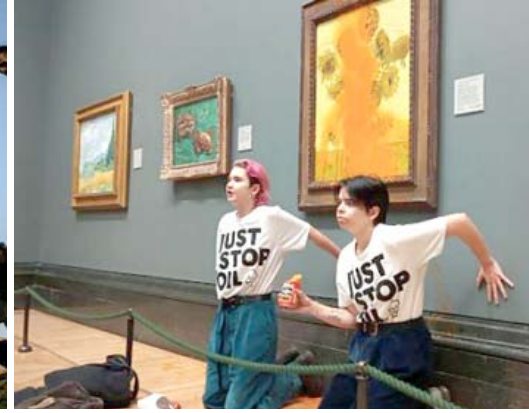
أحداث: رحيل الملكة إليزابيث وحرب أوكرانيا أبرز أحداث 2022

تعوّض "الخسائر والأضرار" المناخية التي تكبدها الدول الأكثر فقرا. كانت الدول الفقيرة تطالب به منذ سنوات وفرضته رسميا على جدول الأعمال في انطلاق المؤتمر الذي أنت نخالجه في مجالات أخرى متفاوتة إلى حد ما. وخشية الإقرار بأي مسؤولية قانونية خصوصا، رفضت الدول الغنية المسؤولة عن إنتاج كميات كبيرة من انبعاثات غازات الدفيئة، القيام بذلك.