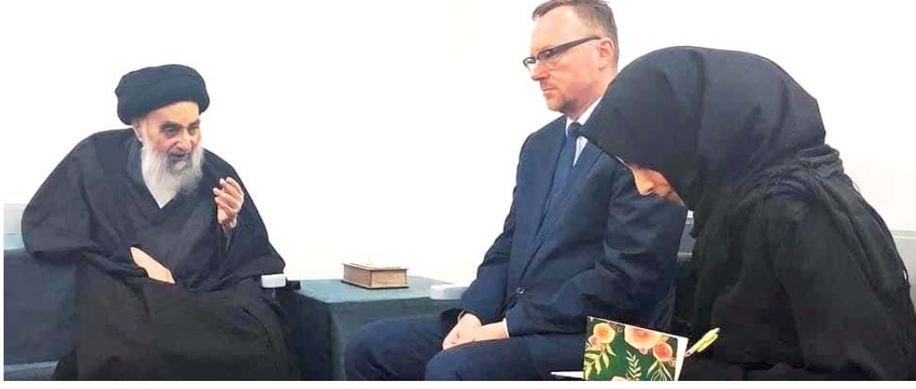
لقاء: المرجع الديني علي السيستاني يلتقي في منزله بالتجف وفداً من الأمم المتحدة

دائماً للسلام والعدالة ضد الجرائم التي الحقتها العصابات بحق الشعب العراقي، وتابع (تغمرنا مشاعر التواضع مع جميع الطوائف العراقية، وأن الفريق يعترف أن جميع الضحايا لديهم الحق في محاكمة مجرمين بدون تسلسل هرمي، معرباً عن امله ب(المضي بعمل السيستاني في نجد العنق وجرائم الإبادة الجماعية)، مشيراً إلى أنه (كان لي الشرف مناقشة التحقيقات التي نفذها فريق في العراق والعالم مع المرجعية)، ومضى إلى القول (لا يمكننا أن ننسى جميع المجتمعات التي عانت وتالت بسبب جرائم عصابات داعش،