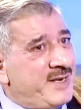
بغداد - ندى شوكت

عصائب اهل الحق قيس الخزلي. والراحل من مواليد عام 1959 شارك في العملية السياسية باول انتخابات جرت في العراق عام 2005 عن جبهة الخوافق وشغل منصب نائب رئيس الوزراء لملف الأمن والخدمات ووزير الدفاع وكالة عام 2006 في حكومة نوري المالكي الأولى. والزوبعي تخرج من كلية الزراعة بجامعة الموصل - قسم علوم التربة والمياه عام 1982 وكان من العشرة الأوائل حصل على شهادة الماجستير . من قسم علوم التربة بكلية الزراعة في جامعة بغداد عام 1987 بتقدير امتياز. وحصل على الدكتوراه من الكلية نفسها عام 1997 انتخبه نقياً للهيئتين الزراعيتين في محافظة الأنبار والبوترة