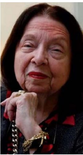
جين فوندا في طور التعافي من السرطان

وقال رئيس الأكاديمية ميرفال بيريرا لصحيفة 'غلوبونيون' التي يكتب مقالات فيها إنها خسارته كبيراً... الوفاة: 58 عاماً