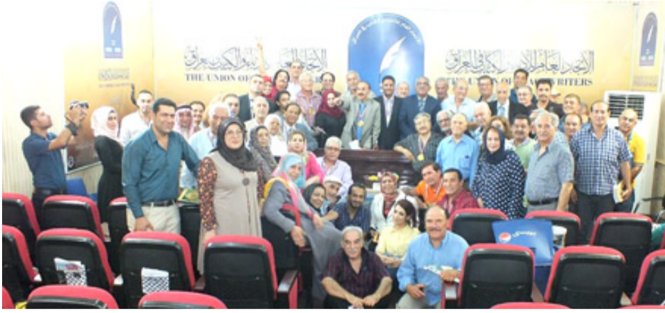
إحتفاء : الملتقى الإذاعي والتلفزيوني يحيي بروتاد الإذاعة (الزمان)