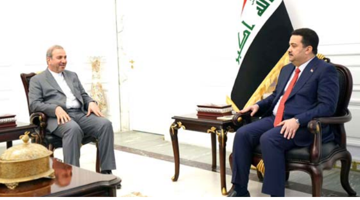
استقبال: رئيس الوزراء الإيراني لدى بغداد

مدار اليومين الماضيين ، متابعة ورصد كافة الأحداث والتطورات السياسية في الدول العربية خلال العام الجاري، والسعي للبحث لحل الأزمات ومتابعة مستجدات الأوضاع في فلسطين واليمن وسوريا ولبنان والعراق ولبنان والسودان والصومال ، وأشار إلى أن (الجلسة تطرقت إلى قضايا الأمن المائي والغذائي، والتغيرات المناخية وتأثيرات ذلك على دول المنطقة والتيارات متعبة كافة القضايا التي تهم المرأة والشباب في الوطن العربي).