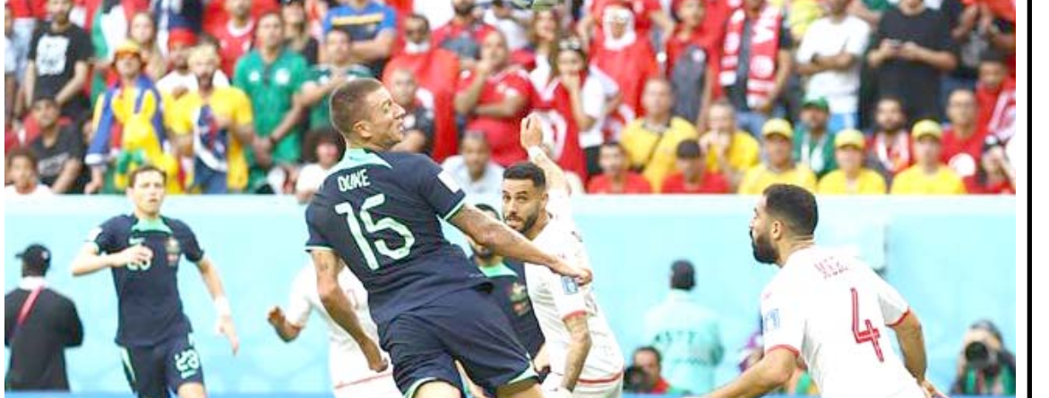
تونس تخسر أمام أستراليا وتعقد موقفها في التأهل

بغداد - قصي منذر الاجتماعي، برود غاضبة عقب تأخر وزارة المالية، بإطلاق تمويل موظفي الوزارات عن موعدها المقرر شهرياً، والذي عزته مالية البرلمان الى التحري عن فضائيين، واكدوا ان