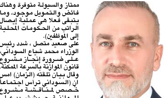
جمال كوجر يبحث في الأشهر الماضية، فالتعميل موجود وجاهز، وأضاف أنها (أول دفعة رواتب تصرفها الحكومة الجديدة، وبالتالي هناك توجهات قد تؤثر في التوقيتات وهو امر طبيعي)، ورجح كوجر ان (يكون التأخير بسبب إجراء إصلاحات في قضية مرتبات الموظفين، ولاسيما ان هناك أكثر من 300 ألف فضاءي، كما لدينا أكثر من 250 ألف موظف ممن يتقاضون أكثر من راتبين)، وأشار إلى ان (مسألة توزيع المرتبات هي إحدى محطت التحقيق في الرواتب وكشف الغشائين، لذلك فإن هذه الإجراءات طبيعية، وأن الحكومة في وضع اقتصادي

ممتاز والسيولة متوفرة وهناك فائض التمويل موجود، وما يتحقق فعلا هي عملية إيصال الراتب من الحكومات المحلية إلى الموظفين). على صعيد متصل ، شدد رئيس الوزراء محمد شياع السوداني، على ضرورة إنجاز مشروع قانون الموازنة بالسرعة الممكنة. وقال بيان تلقته (الزمان) ان (السوداني تراس اجتماعاً خصص لمناقشة مشروع الموازنة، حيث شدد على ضرورة إنجاز مشروع القانون بالسرعة الممكنة، وتقديمه إلى مجلس النواب، حتى يدخل حيز التنفيذ من دون تأخير، ولغى أن (القانون يستهدف في تخصصاته، الأولويات التي تبنها المنهاج الوزاري، وهي مكافحة البطالة وتقليل نسب الفقر ومكافحة الفساد والارتقاء بالخدمات، فضلاً عن إصلاح الاقتصاد، ووجه السوداني بيان (براع مشروع القانون أهمية تقديم مشاريع البنى التحتية على غيرها من المشاريع، من أجل تهيئة البيئة الملائمة في الاقتصاد الداخلي لتحقيق