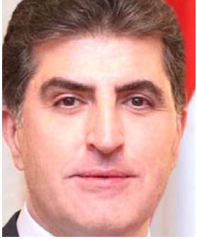
اريل - فريد حسن تعهّد رئيس إقليم كردستان نيجيرفان البارزاني، بتقديم الدعم الكامل لكفاح وحرية وحقوق المرأة والمساواة وتحسينها من المضايقات، وأكد أنه لا تم تحنر المرأة لن يحقق مجتمع حر متساو وأمن ومدني متقدم. وقال البارزاني بمناسبة مناهضة العنف ضد المرأة في بيان تابعته (الزمان) (إننا نثق بكل الطرق في وجه جميع أنواع العنف والاعتداء والإنتهاك لحقوق وحرية المرأة)، مؤكداً انه سيستمر في العمل من أجل القضاء على الفكر المتشدد الذي تهدد أرضية أفضل للمرأة وشراكة المرأة في المعترك السياسي والإداري والاقتصادي، فضلاً عن إصلاح الاقتصاد، ووجه السوداني بيان (براع مشروع القانون أهمية تقديم مشاريع البنى التحتية على غيرها من المشاريع، من أجل تهيئة البيئة الملائمة في الاقتصاد الداخلي لتحقيق

ممتاز والسيولة متوفرة وهناك فائض التمويل موجود، وما يتحقق فعلا هي عملية إيصال الراتب من الحكومات المحلية إلى الموظفين). على صعيد متصل ، شدد رئيس الوزراء محمد شياع السوداني، على ضرورة إنجاز مشروع قانون الموازنة بالسرعة الممكنة. وقال بيان تلقته (الزمان) ان (السوداني تراس اجتماعاً خصص لمناقشة مشروع الموازنة، حيث شدد على ضرورة إنجاز مشروع القانون بالسرعة الممكنة، وتقديمه إلى مجلس النواب، حتى يدخل حيز التنفيذ من دون تأخير، ولغى أن (القانون يستهدف في تخصصاته، الأولويات التي تبنها المنهاج الوزاري، وهي مكافحة البطالة وتقليل نسب الفقر ومكافحة الفساد والارتقاء بالخدمات، فضلاً عن إصلاح الاقتصاد، ووجه السوداني بيان (براع مشروع القانون أهمية تقديم مشاريع البنى التحتية على غيرها من المشاريع، من أجل تهيئة البيئة الملائمة في الاقتصاد الداخلي لتحقيق