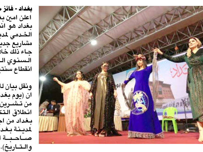
احتفال: جانب من الاحتفال بيوم بغداد

مجلس الوزراء الاخيرة لاسانة بغداد وما اعلان امين بغداد عمار موسى كاظم بان يوم بغداد هو انطلاقة جديدة للنهوض بالواقع الخدمي لمدينة بغداد والشروع بتنفيذ مشاريع جديدة في العاصمة.