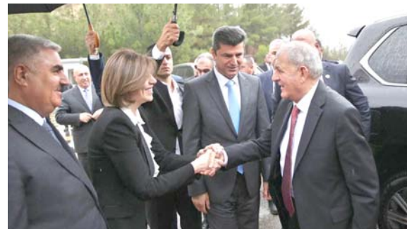
دهوك - الزمان أربيل - فريد حسن

التقى رئيس الجمهورية عبد اللطيف جمال رشيد ، رئيس الحزب الديمقراطي الكردستاني مسعود البارزاني وعدد من القيادات الكردية خلال جولته جريها في إقليم كردستان منذ يومين ، لبحث الملفات المشتركة والاطلاع على مخيمات النازحين.