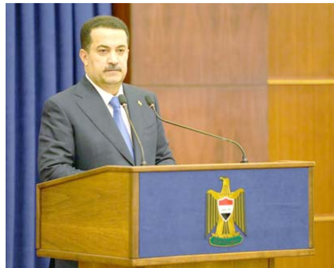
كلمة: رئيس الوزراء محمد شياع السوداني يلقي كلمته الاسبوعية

مجلس الوزراء يخول رئيس الحكومة سحب مشاريع قوانين قيد المناقشة في البرلمان السوداني: نحرص على حل مشاكل الإقليم وتنشيط مجلس التنسيق العراقي السعودي