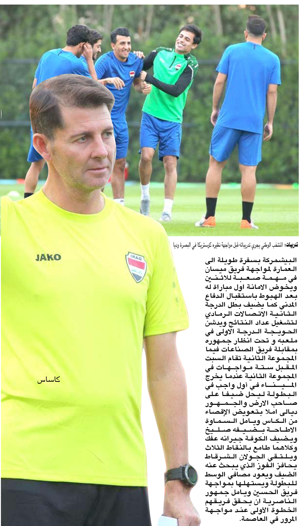
تدريباً: المنتخب البرازيلي يجري تربيته قبل مواجهة نظيره كوستاريكا في البصرة وبيا

الكل سيجدد الثقة بلاعبي الوطني في تقديم مواجهة أفضل من الإكوادور . منافس صعب نعم اننا سنواجه منافسا صعبا لكن منتخبنا اليوم هو في وضع أفضل إضافة الى مكان اللعب وقبلها نتيجة التعامل مع الإكوادور وهذه امور يجب ان تستغل لكي تبدأ مرحلة العمل بشكل أفضل طالما المنتخب يبحث عن تعويض فترة السراب التي مر بها المنتخب بعد سلسلة من نتائج الفشل الكبير على جميع المشاركات الى سمية والودية وقبلها التخطي حيث حل المنتخب ما انعكس على المستوى العام قبل ان تظهر الحاجة الى دعوة سبعة لاعبين ممن شاركوا في الفترة السابقة يجب ان يكون التركيز الأساسي في عملية اعداد المنتخب وان يقف على طول قامته كما لا يمكن ان يجرد لاعبي الخبرة والبقاء على الشباب الذين يحتاجون الى عمل طويل .